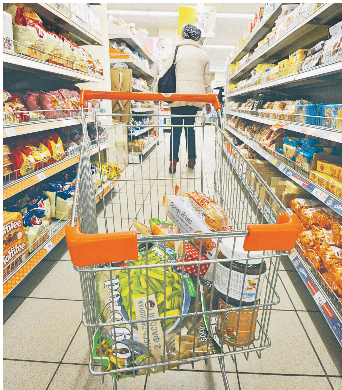
Одним из индикаторов падения доходов населения стало рекордное снижение покупательной способности россиян. Она упала до минимума за последние десять лет, по оценке Центра развития ВШЭ

Одновременно последствием карантинных ограничений стало снижение трудовых доходов россиян: работников переводили на неполный рабочий день и отправляли в неоплачиваемые отпуска. По результатам опросов НИУ ВШЭ в мае—июне 2020 года,