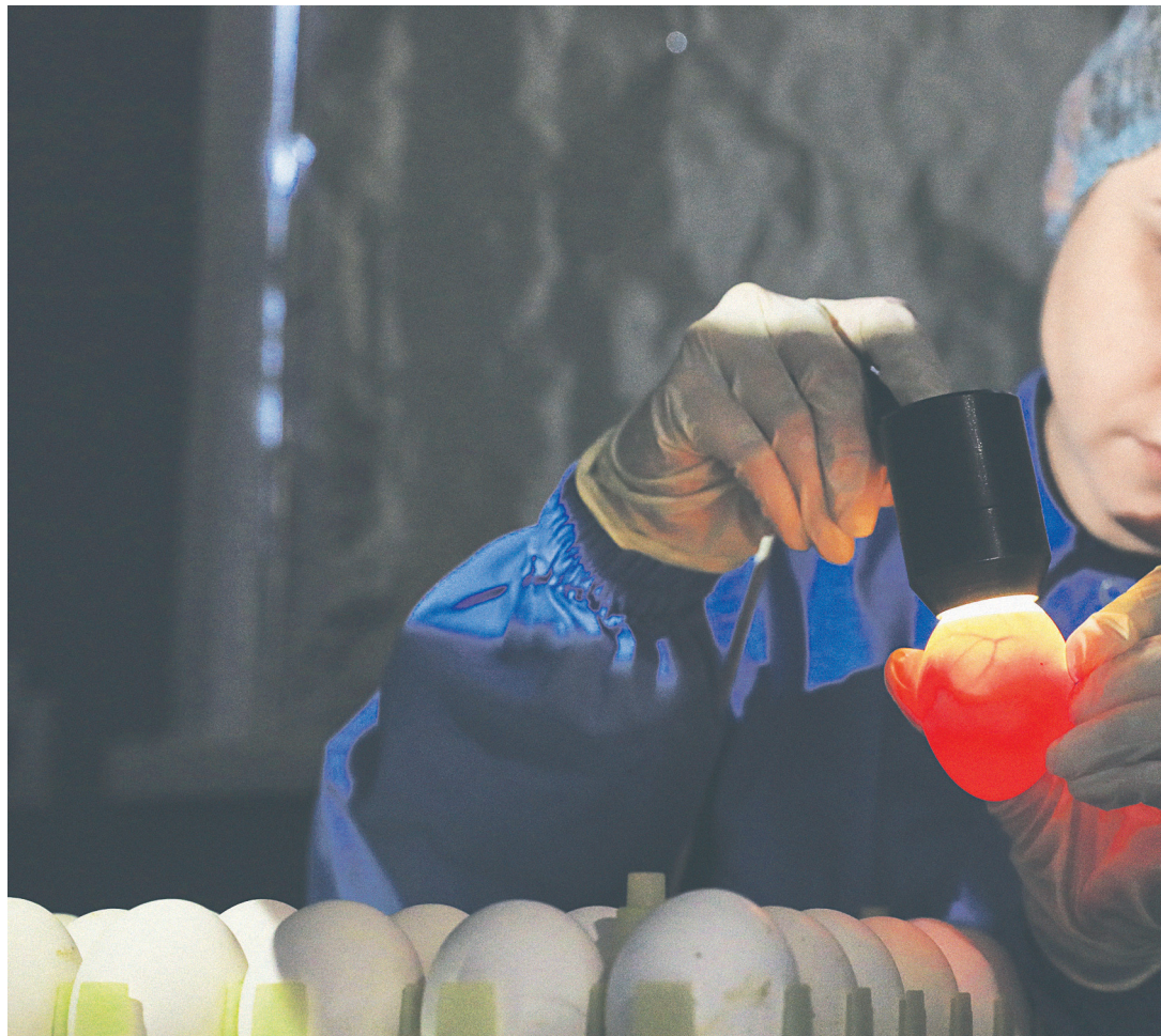
На фармацевтическом заводе «Форт» (Рязанская область) для создания четырехвалентной вакцины «Ультрикс Квадри» штаммы гриппа выращивают в куриных яйцах

В 2019 году поставили «Ультрикс» в государственные заведения, по оценке DSM Group, на 880 млн руб., тогда как «Совигрипп» от НПО «Микроген» — на 6,8 млрд руб., «Флю-М» от Санкт-Петербургского НИИ вакцин и сывороток — на 3,4 млрд руб.