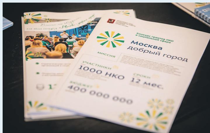
Конкурс грантов «Москва — добрый город»

Гранты будут распределены по трем категориям в зависимости от опыта проектной деятельности НКО. Мы разыграем гранты крупного размера (свыше 5 млн руб.) среди опытных организаций, которые работают больше трех лет и готовы вложить в проект 10% собственных или привлеченных средств. Для НКО с опытом работы в социальной сфере более двух лет и готовых профинансировать свой проект на 5% есть возможность подачи заявки на грант среднего размера — от 500 тыс. до 5 млн руб. Среди новичков, желающих заявить о себе, мы разыграем гранты до полумиллиона».