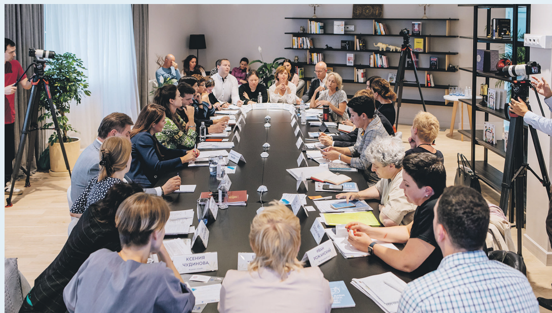
В форсайт-сессии 5 сентября 2019 года приняли участие представители органов соцзащиты, общественные и волонтерские организации, благотворительные фонды, бизнес и СМИ

Фонд «В.Н.У.К.» участвовал в прошлогоднем конкурсе и получил 400 тыс. руб. на создание онлайн-платформы для привлечения потенциальных волонтеров из числа обычных москвичей. «Люди хотят помочь своим