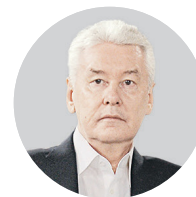
СЕРГЕЙ СОБЯНИН, мэр Москвы

Столичные власти обсуждают введение новых ограничений из-за коронавируса