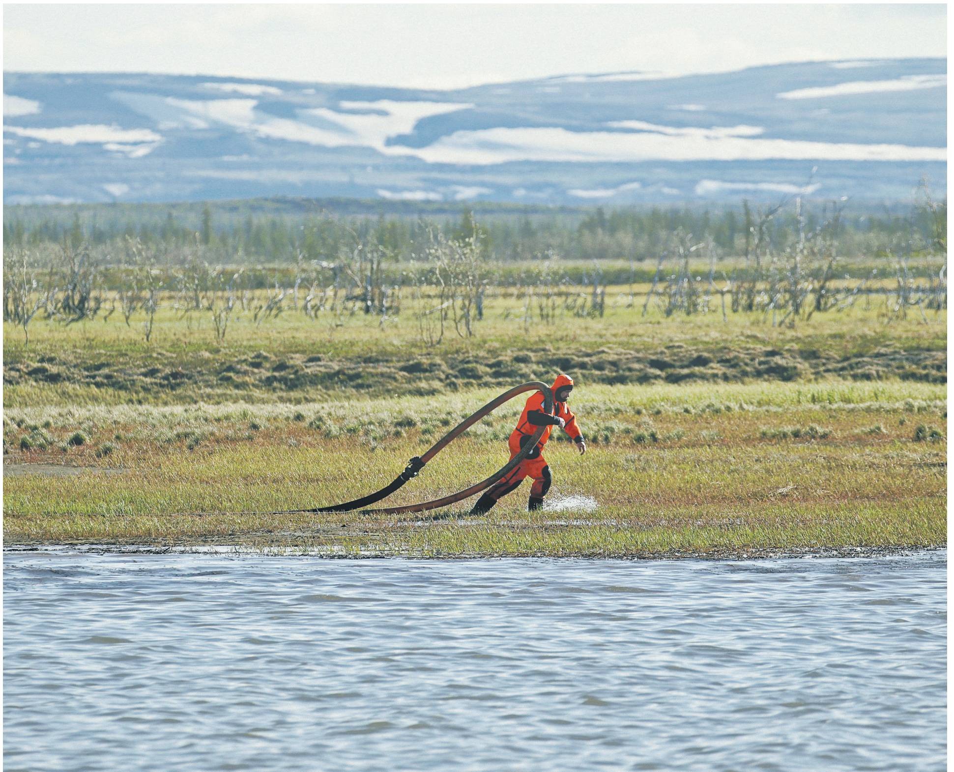
Разлив дизельного топлива в Красноярском крае был признан ЧС федерального характера