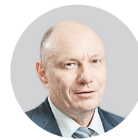
ВЛАДИМИР ПОТАНИН, глава «Норникеля»

Росрыболовство определилось с претензиями к «Норникелю» из-за аварии в Красноярском крае