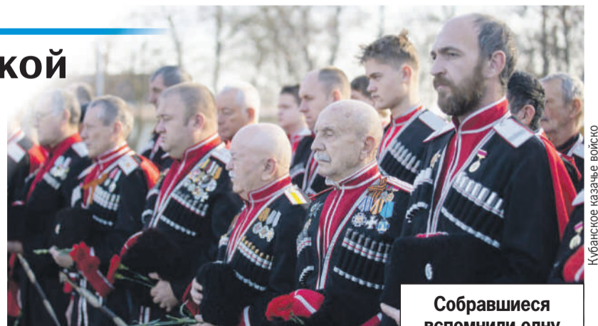
Собравшиеся вспомнили одну из самых страшных страниц в истории станицы - события 27 ноября 1942 года.

В рамках поминальных мероприятий была объявлена минута мол-