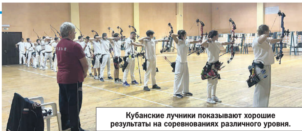
ГБУ КК «РЦСП № 2»

8 Температура воздуха является важным фактором для планирования тренировок. Если столбик термометра опускается ниже -15 °C, большинство экспертов не рекомендуют интенсивные уличные тренировки. В морозы занятия можно перенести в зал или же выбрать онлайн-занятия в домашней обстановке.