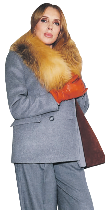
Личная страница Светланы Болдарчук в социальной сети Виктор ГУСЕИНОВ