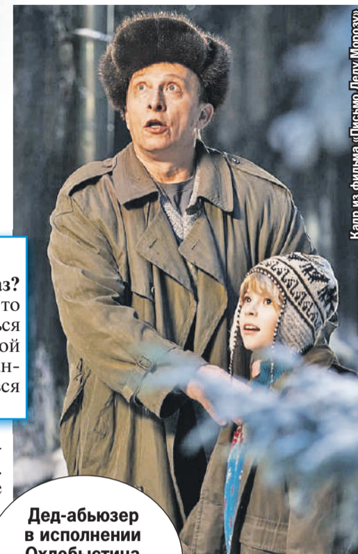
Кадр из фильма «Письмо Деду Морозу»

- Перед Новым годом каждый раз выбирают «слова года». В 2022-м в топе было слово «Гойда», означающее при-