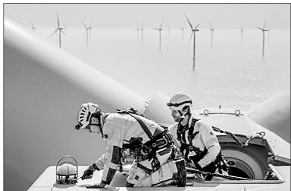
Морские ветряные электростанции в Германии.