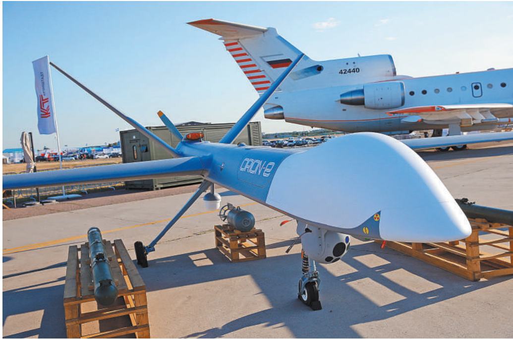
Гражданский беспилотник самолетного типа «Орион» стал основой разведывательно-ударного «Иноходца».

Для «Ориона» был специально разработан достаточно ори-