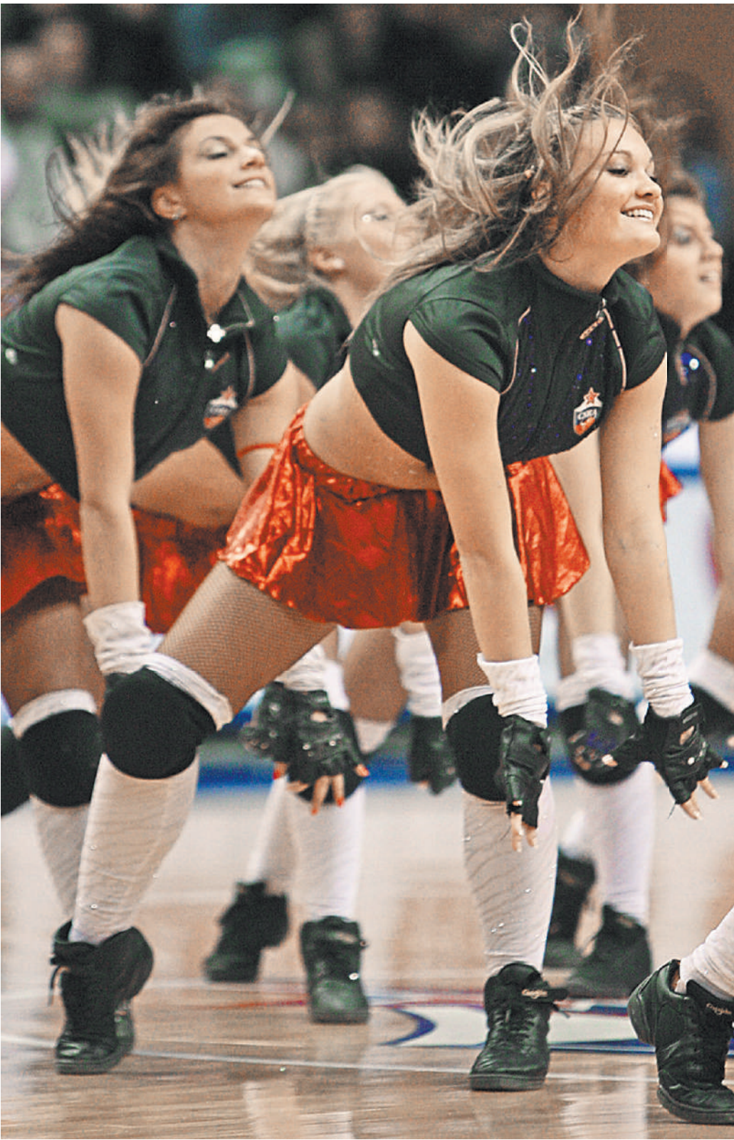
Чирлидинг и гольф планируют запретить в школах.