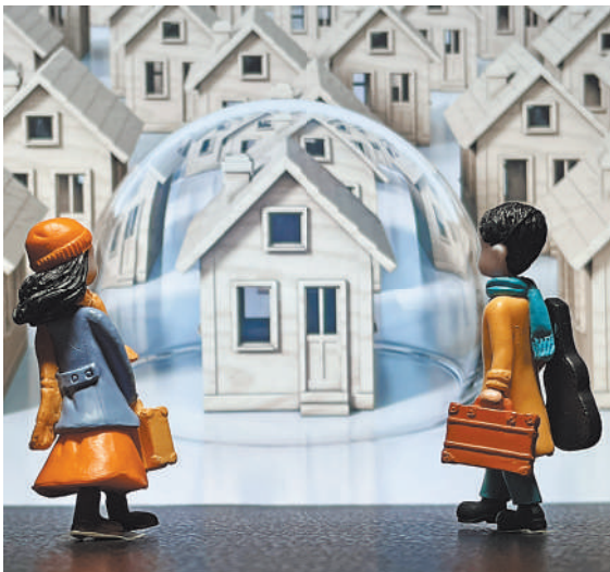
«Семейная ипотека» стала невероятно популярной после модификации других льготных программ.

Основная интрига сейчас — ограничатся ли дело перераспределением между банками уже выделенных средств или все же в госбюджете найдутся дополнительные суммы на программу. С учетом нынешней ключевой ставки затраты бюджета на субсидирование ипотеки под 6% весьма высоки. Минфин на запрос «РГ» о возможном выделении дополнительных средств не ответил.