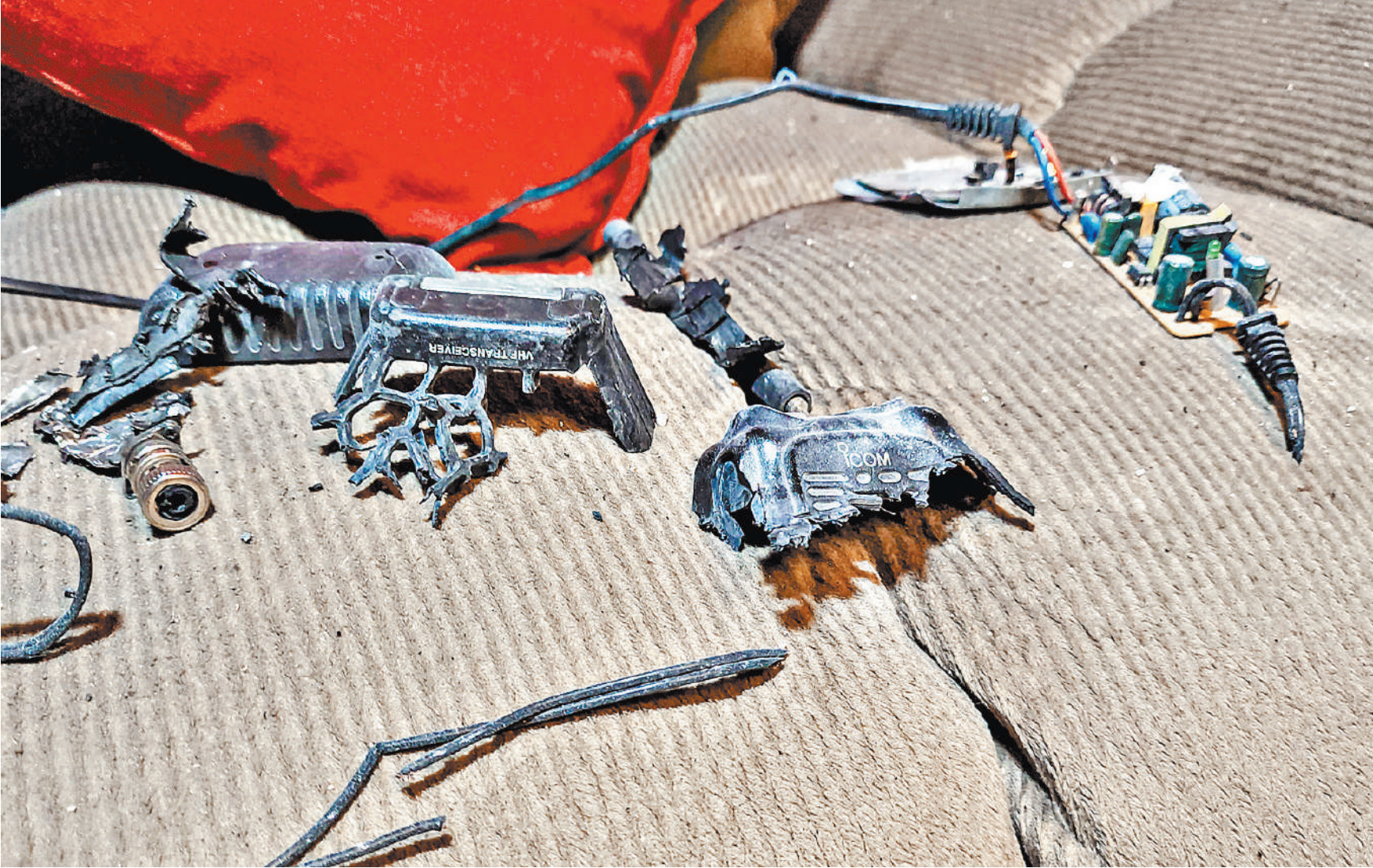
После серии взрывов пейджеров, раций и других приборов власти Ливана просят граждан сообщать о любых подозрительных устройствах.

Но тотальный контроль всего ассортимента, предна-