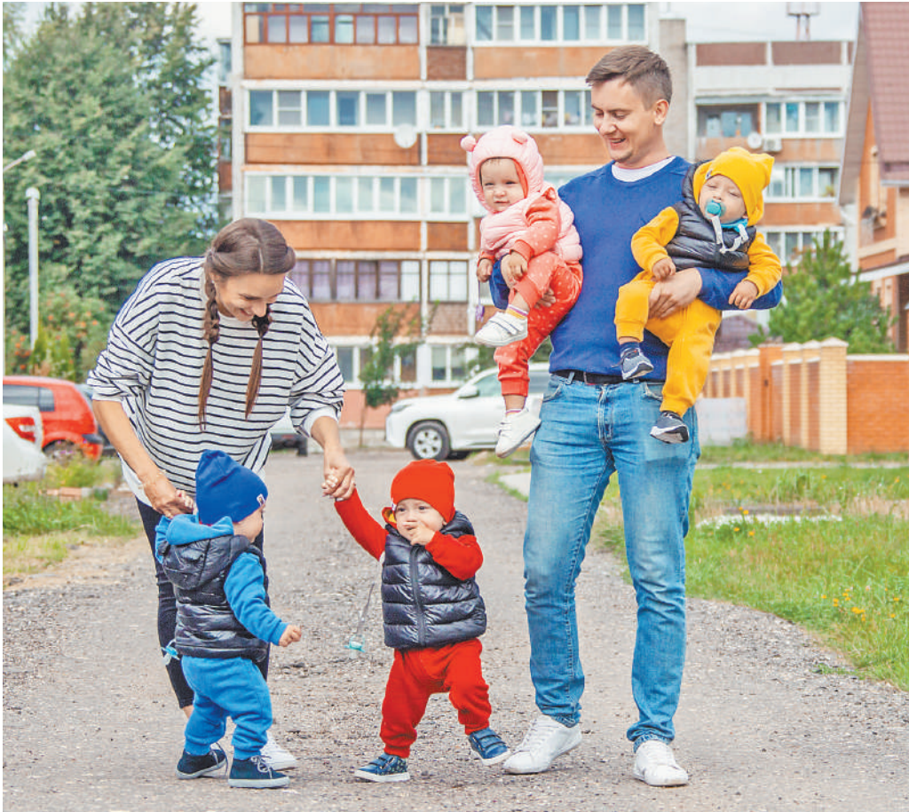
Что бы ни проповедовали чайдлфри, семья остается для россиян главным приоритетом.

Главное же, что стоит отметить — ярославские силовики сумели не допустить криминальных разборок, которые могли бы иметь тяжелые последствия. ●