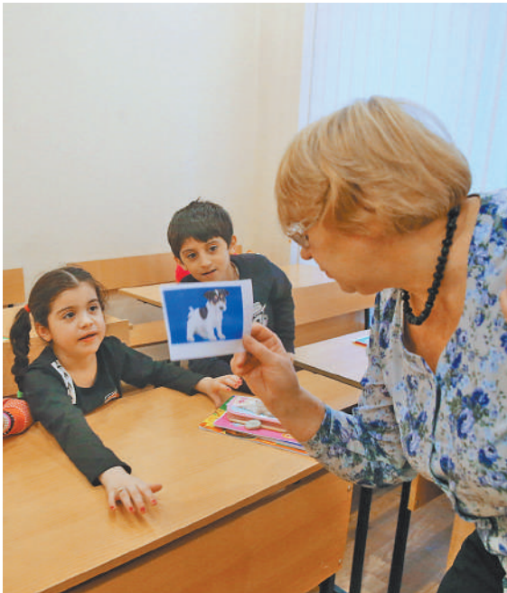
В классах, где большинство учеников — дети мигрантов, учителям работать сложно.

По словам женщины, у земляков была мысль организовать специальные занятия для детей, которые плохо знают русский, или даже отдельный класс. Но у школы нет возможности, учителей не хватает. Да и детям хочется учиться вместе со всеми. ●