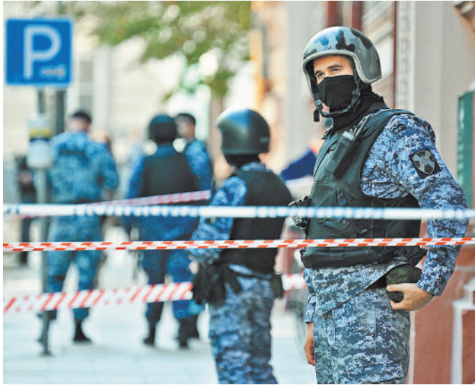
РПНОВОСТИ Корпоративный конфликт привел к перестрелке в офисе Wildberries. Цивилизованными методами решать спор одна из сторон не захотела.

Ранее в Следственном комитете РФ сообщили, что 18 сентября в офисе Wildberries произошла стрельба, в результате пострадали 7 человек, в том числе двое сотрудников правоохранительных органов, прибывших на вызов для пресечения противоправных действий. «От полученных повреждений два человека скончались», — сообщали в СК РФ.