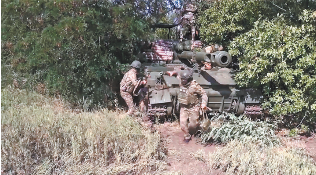
По словам бойцов, дружба помогает им с полуслова понимать друг друга и быстрее выполнять боевые задачи.

Расчеты самоходок «Акация» есть и в штате группировки российских войск «Запад». Накануне они точными попаданиями уничтожили замаскированные взводные опорные пункты и живую силу ВСУ. Артиллеристы в круглосуточном режиме продолжают наносить точные удары по военным объектам, позициям, фортификационным сооружениям, боевой технике и живой силе ВСУ.