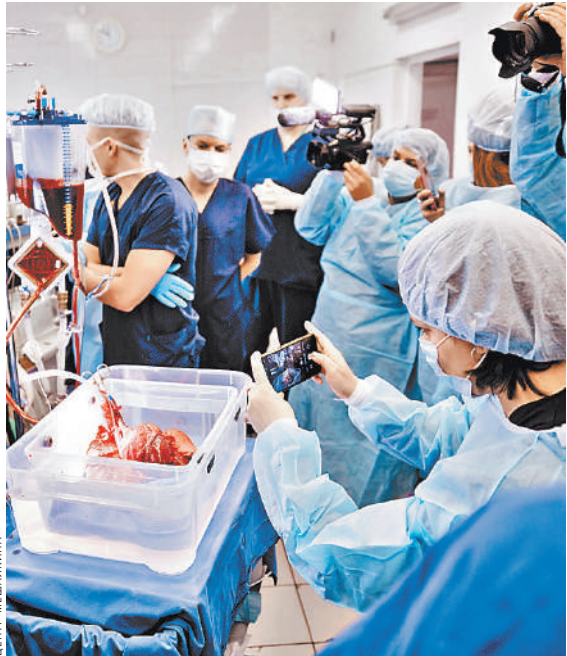
В специальном кувезе сердце можно будет доставить в любой регион России.

Новая технология станет основой для создания отечественного контейнера для перевозки работающего донорского сердца к реципиенту на дальние расстояния. В Центре Мешалкина уже запатентовали конструкцию кувеза. Опытный образец транспортирующей платформы донорского сердца в Сибири планируют разработать в течение ближайших трех лет. ●