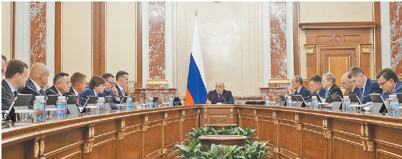
Михаил Мишустин на заседании кабинета: Важно, чтобы средства как можно скорее поступили в регионы.

А для Хабаровского края правительство предусмотрело почти 700 миллионов рублей, чтобы помочь в благоустройстве еще не менее 100 дворовых территорий. Это часть большой дальневосточной программы «1000 дворов». «Она помогает местным жителям самим, самостоятельно выбирать, где будет идти обустройство придомовых участков. И главное — быть активными, проявлять инициативу и стремиться изменить окружающее пространство — дворы, скверы, парки — к лучшему», — напомнил Михаил Мишустин. ●