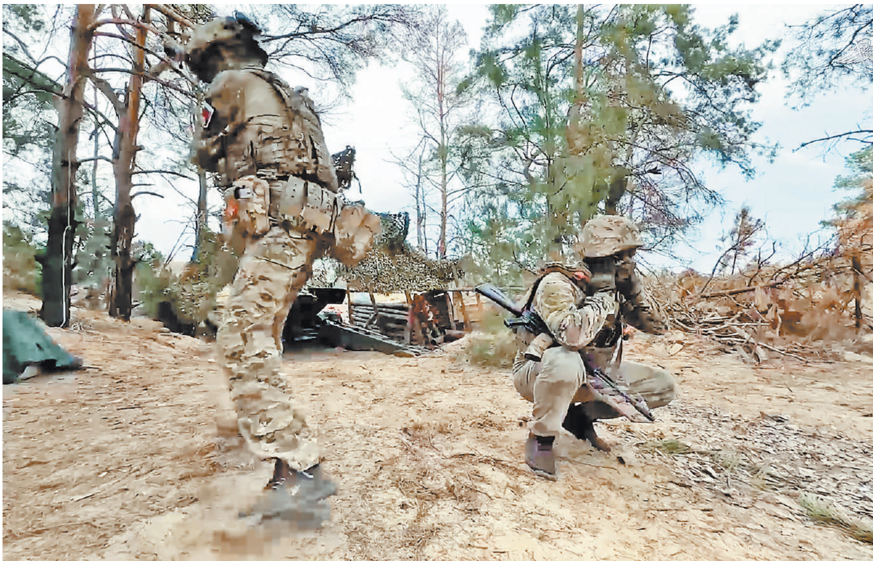
Крупнокалиберная пушка «Гиацинт-Б» в строю уже около 60 лет, однако без особых проблем «разбирает» как легко укрепленные блиндажи, так и залитые в бетон блиндажи и доты.