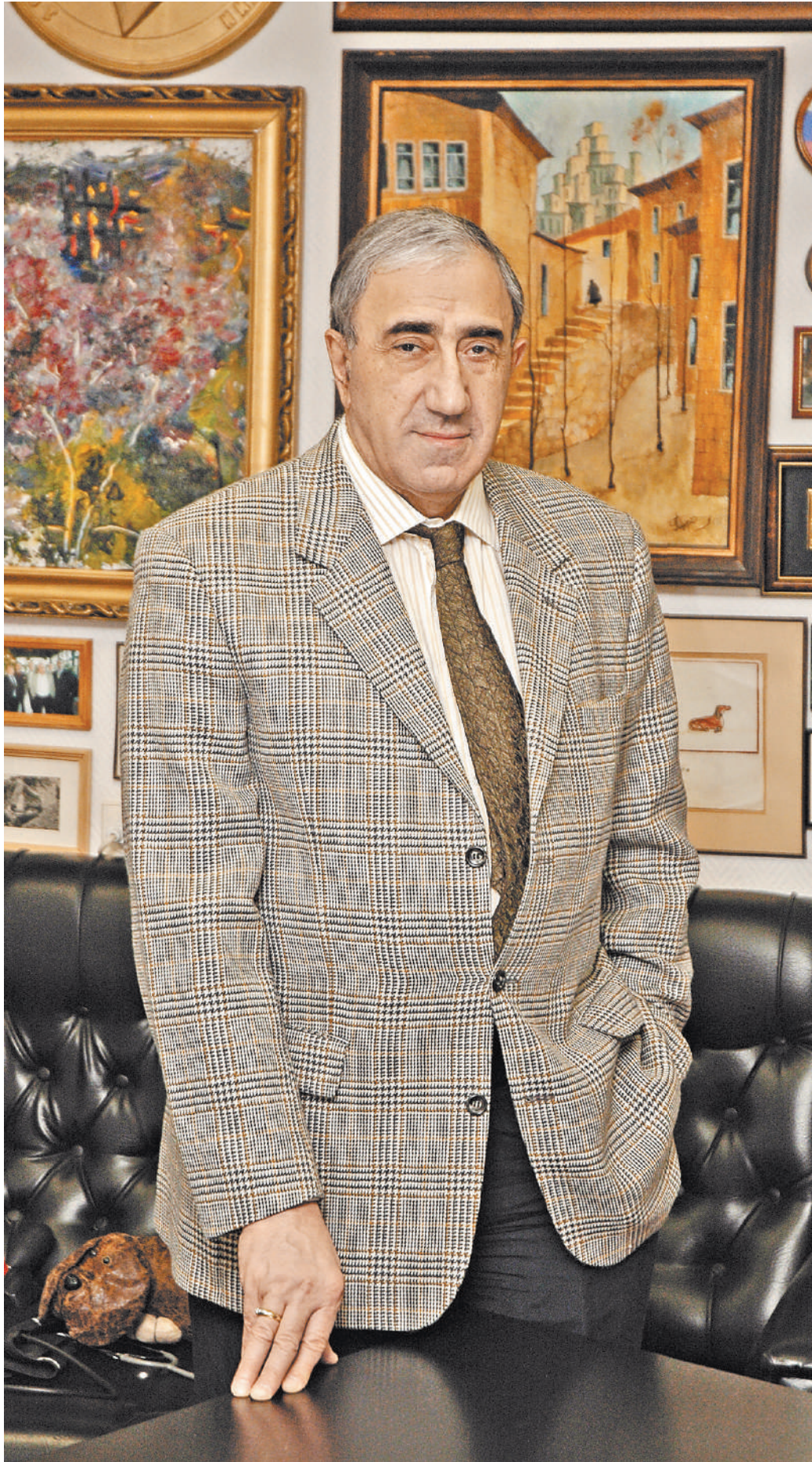
из личного архива

Казалось бы, чего еще можно пожелать? Но, как оказалось, кто-то посчитал, что этого мало. Я с удивлением узнаю, что в Москве стали, буквально как грибы, вырастать новые высшие учебные заведения с меди-