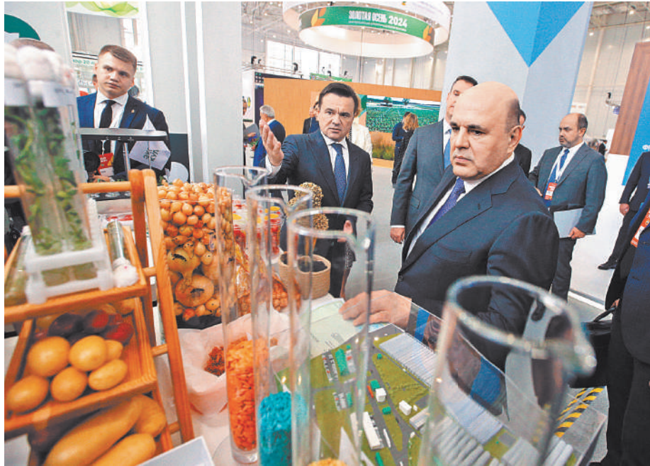
Губернатор Московской области Андрей Воробьев представил Михаилу Мишустину проекты региона в сфере семеноводства и генетики.

Весомые результаты будут и в этом году. «В регионах завершается уборочная кампания. По данным минсельхоза, собрано около 120 миллионов тонн зерна», — сказал Мишустин. По его словам, ожидается также хороший урожай риса, подсолнечника, овощей. Такие успехи — заслуга наших сельхозпроизводителей, отметил Мишустин. Кабмин со своей стороны всегда внимательно реагирует на запросы отрасли, добавил он и сообщил, что в проекте федерального бюджета на будущий год на поддержку сельского хозяйства предусмотрены 560 миллиардов рублей. ●