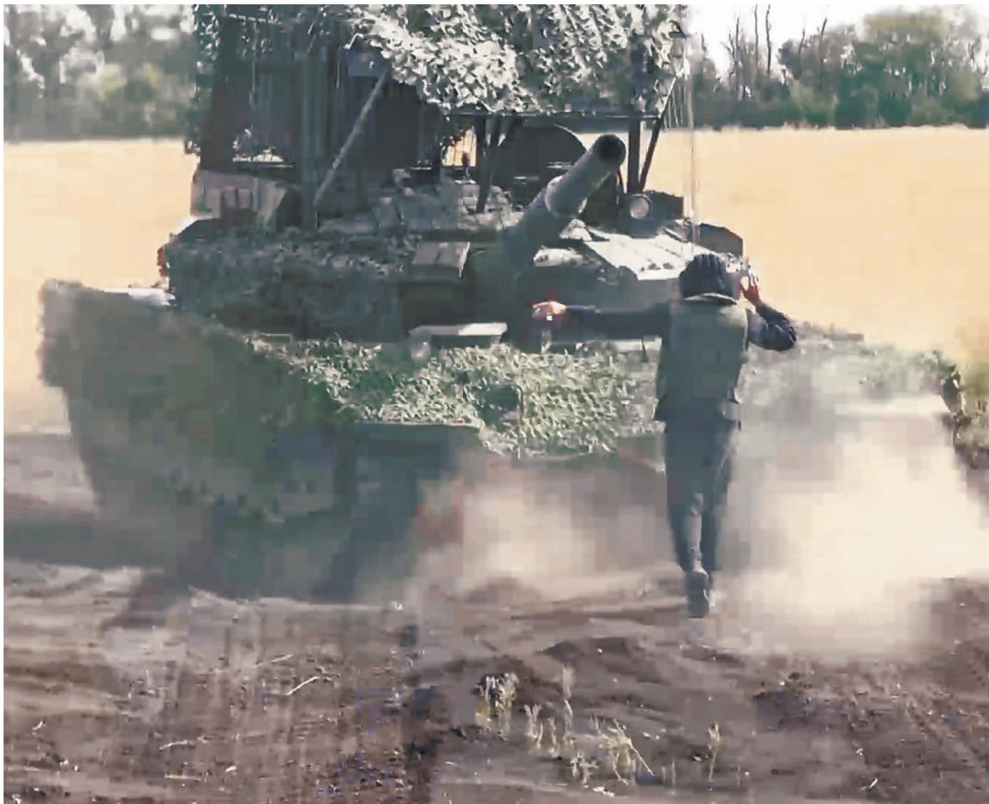
Танки Т-80, усиленные защитой от дронов, помогают продвижению подразделений группировки «Восток» под Угледаром.