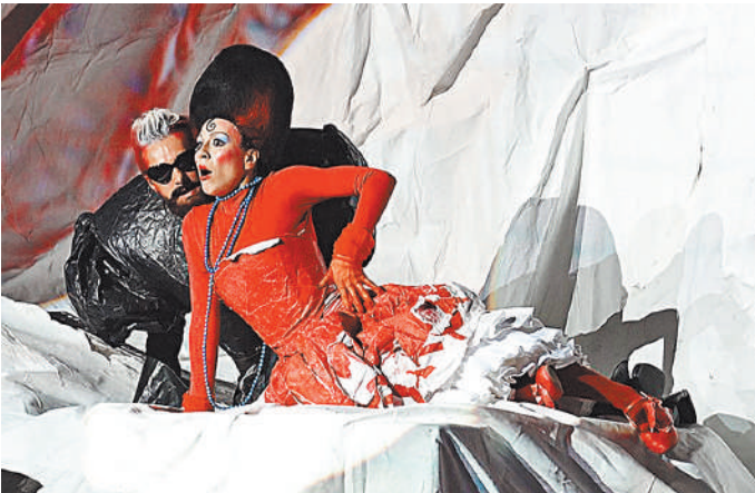
«Каменный гость» в БДТ им. Товстоногова — не просто пересказ «маленькой трагедии» Пушкина, а новая современная трактовка сюжета.