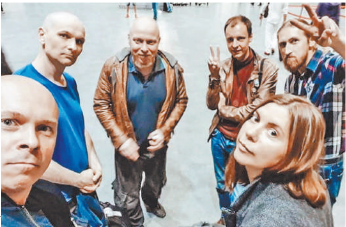
Группа Theodor Bastard — один из основоположников жанра world music в России.

И эта электронная группа тоже на гастролях. 10 октября — Москва, дальше — по России. Синтезаторы, языче-