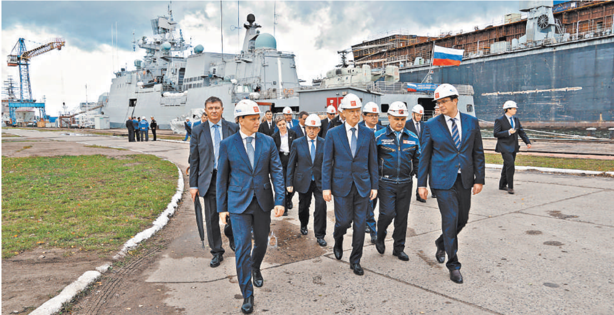
С момента образования в августе Морской коллегии РФ Николай Патрушев побывал на Северном, Тихоокеанском и Балтийском флотах. А также осмотрел производство и провел совещания на ведущих кораблестроительных заводах страны.

шается, продолжается проведение специальной военной операции, от госзаказчика, головных исполнителей и исполнителей государственных контрактов требуется максимальная отдача. —Наши корабли по своим характеристикам и по технологическому потенциалу должны превосходить аналогичные корабли вероятного противника,—подчеркнул он. Как заметил в беседе с «РГ» Патрушев, Россия, являясь великой морской державой, должна обладать мощным военно-морским флотом, в состав которого войдут корабли, предназначенные для выполнения задач в ближних, дальних морских зонах и океанских районах, иметь развитую систему базирования и обеспечения. —По сути дела, наступает очередной этап развития ВМФ. Государству требуется обеспечить такое качество нашего флота, которое позволит опередить технические возможности других морских стран,—констатировал Николай Патрушев. Напомним, что указ о создании Морской коллегии РФ Владимир Путин подписал 13 августа. В ее составе были созданы советы по стратегическому развитию Военно-морского флота РФ, по защите национальных интересов России в Арктике, по развитию и обеспечению морской деятельности РФ. В числе задач коллегии—укрепление обороны и безопасности России в Мировом океане, развитие Северного морского пути как национальной транспортной коммуникации РФ и обеспечение гарантированного доступа России к глобальным транспортным коммуникациям, а также предотвращение загрязнения морской среды. ●