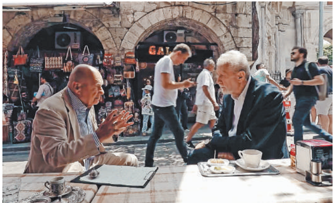
Собеседником Владимира Познера в цикле «Турецкая тетрадь» станет известный писатель, нобелевский лауреат Орхан Памук.

Документальный цикл Владимира Познера «Турецкая тетрадь» на Первом канале с 14 октября в 00.00 «Турецкая тетрадь» — это субъективный взгляд известного журналиста на прошлое и настоящее Турции. На этот раз собеседником Познера стал турецкий писатель Орхан Памук, лауреат национальных и международных литературных премий. В 2006 году писатель был удостоен Нобелевской премии по литературе с формулировкой: «Автору, который в поисках меланхолической души родного города нашел новые символы для столкновения и переплетения культур». В октябре восемь серий. На неделе с 14 октября покажут четыре из них: «Стамбул. Города и воспоминания» — Орхан Памук станет главным продвигателем Познера и поможет разгадать тайну великого города; «Ибелль империи» — ведущий исследует феномен Османской империи; «Отец нации» — посвящение основателю и первому президенту Турецкой республики Мустафе Кемалю Ататюрку. А также «Турецкий ислам».