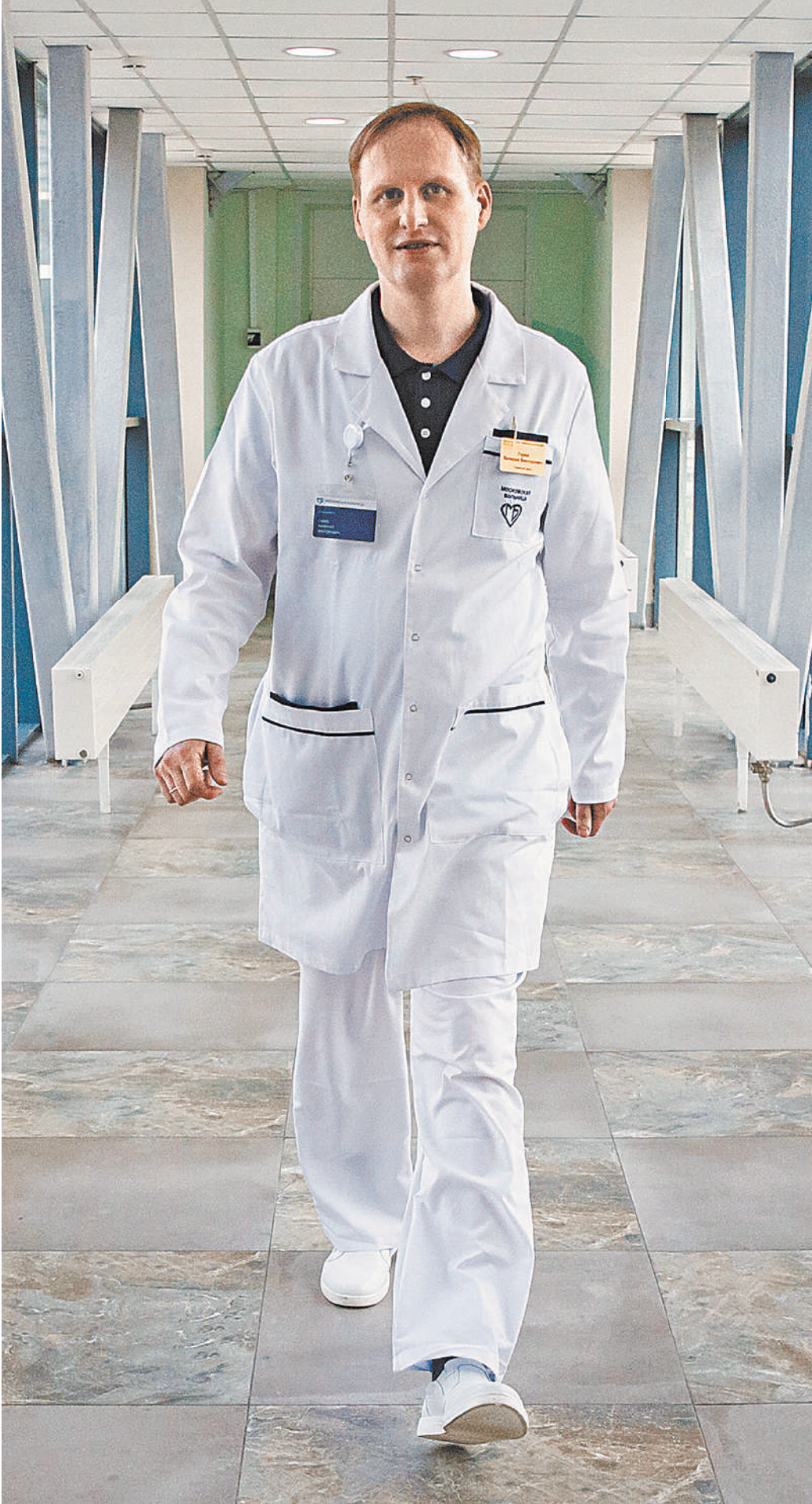
ВЕРЕСКАЯ / ФОТОГРАФ

ВАЛЕРИЙ ГОРЕВ: А ведь могут простудиться! Более того, это может привести к проблемам репродуктивного здоровья. Диктат моды неумолим? Пусть звучит банально, но надо вести соответствующую работу. Не исключено, что здесь могут участвовать и неонатологи. Воспитание будущих родителей,