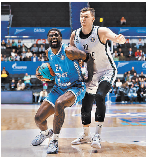
В матче с «Нижним» питерцам пришлось показать характер.

13 октября, воскресенье «Матч ТВ» 17.00. ЦСКА — «Зенит». Прямая трансляция