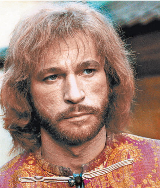
Точка в деле о гибели Игоря Талькова пока не поставлена.