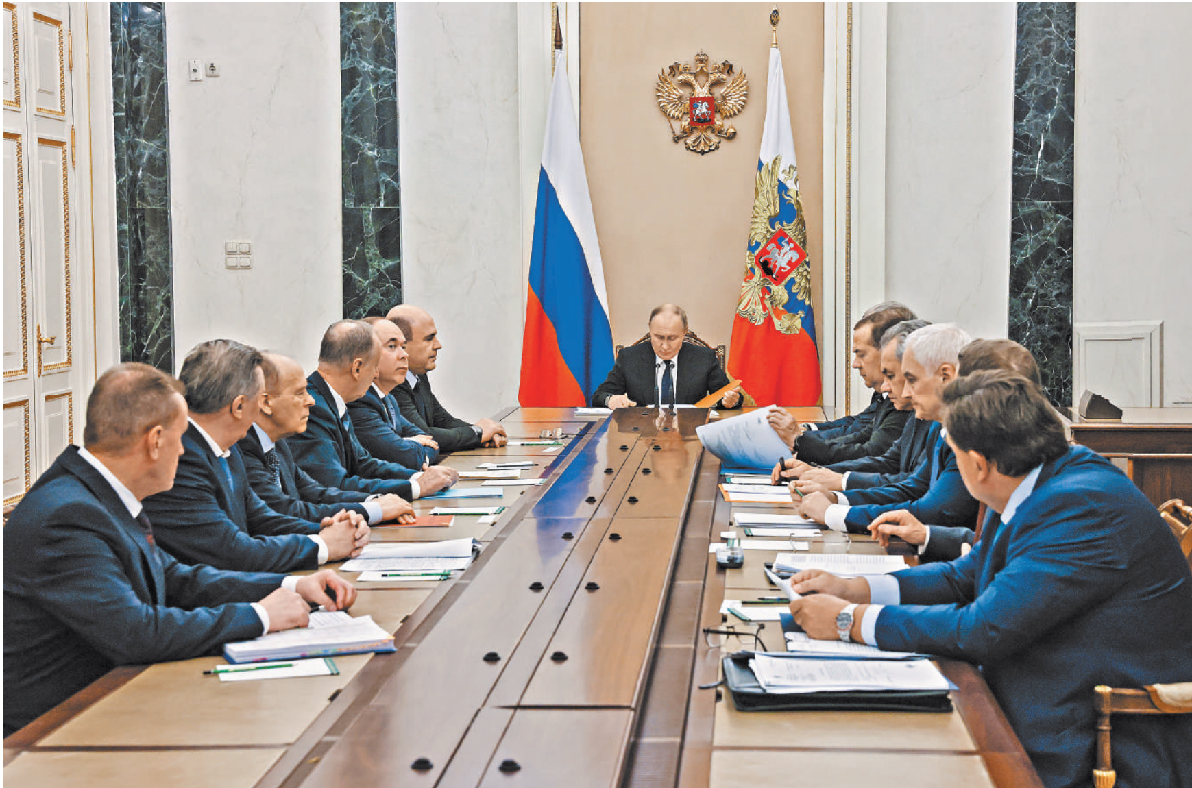
Президент России Владимир Путин вчера обсудил с постоянными членами Совбеза РФ развитие уголовно-исправительной системы страны. С докладами выступили министр юстиции Константин Чуйченко и директор Федеральной службы исполнения наказаний (ФСИН) России Аркадий Гостев.