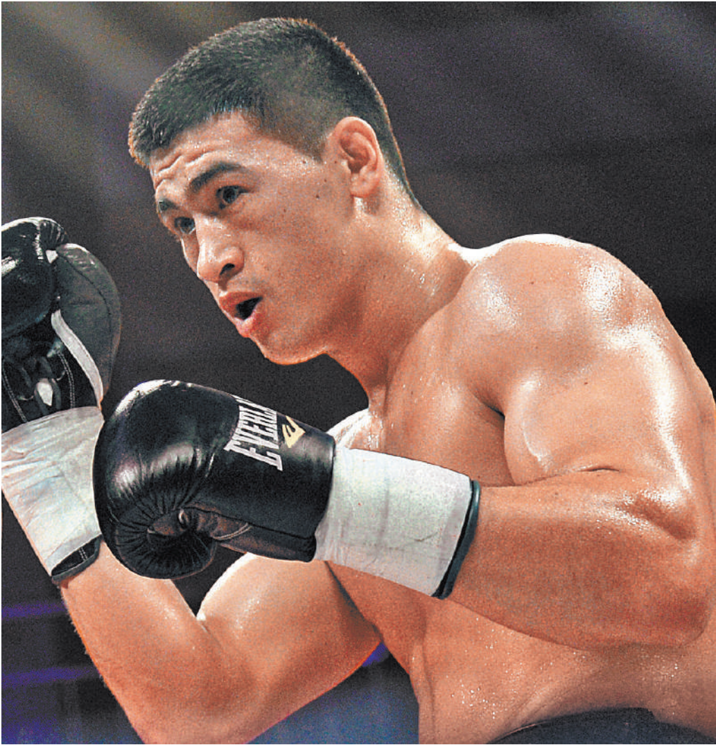
Бивол подтвердил: они с Бетербиевым не друзья. Но тут ничего личного, только бизнес, шанс осуществить мечту.

ГДЕ БУДЕМ СМОТРЕТЬ 12 октября, суббота Первый канал 23.30. Бой за звание абсолютного чемпиона мира в полутяжелом весе Артур Бетербиев — Дмитрий Бивол. Прямая трансляция