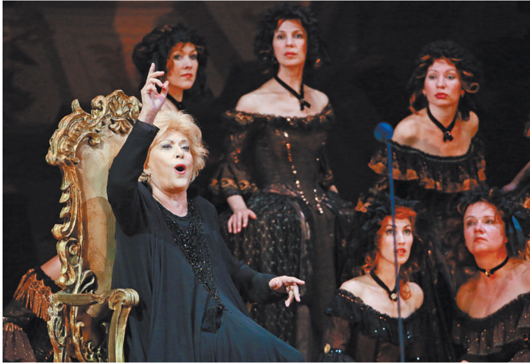
Впервые «Оперный бал» в честь Елены Образцовой состоялся в 2014-м, и это был последний концерт в жизни дивы.

На балу будет представлен двухтомник Михаила Пащенко «Оперный бал Елены Образцовой» — документальная биография, созданная на основе архивных материалов. Туда войдут выдержки из дневников, писем, мировой прессы, документов государственных архивов, из интервью друзей и коллег. В книге опубликованы около 700 архивных фотографий.