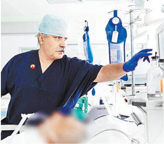
Важным фактором успеха стал опыт анестезиологов-реаниматологов, накопленный во время пандемии коронавируса.

Фактором успеха стал не только молодой возраст пациента, но и опыт анестезиологов-реаниматологов в выхаживании больных с тяжелой дисфункцией легких, накопленный во время пандемии, — поясняют в Центре Мешалкина. Врачи отмечают, что вся медицинская помощь была оказана больному за счет средств государственного бюджета. ●