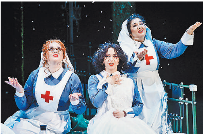
«Беатриче и Бенедикт» — редкая для оперы счастливая история любви.