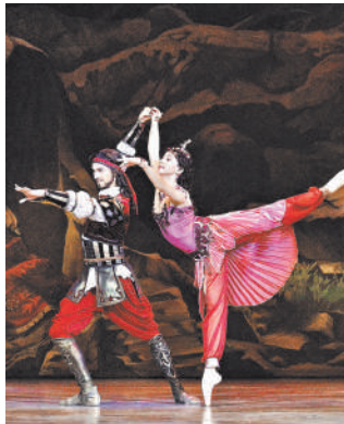
На сцене Красноярского театра оперы и балета — «Корсар».

Обычно к «Корсару» обращаются, когда в афише уже есть полный комплект шедевров классического балета первого ряда, а зритель ждет все новых сказок в пачках, при этом в труппе простаивают несколько поколений сильных солистов. «Корсар», как художественное целое представляющий балетный аналог салата оливье, служит для заделывания именно такой репертурной лакуны. В середине XIX века он был одним из последних отзвуков балетного романтизма, эффектно паразитируя на имени Байрона. Потом «Корсар» почти на полвека попал в руки Мариуса Петипа, который кроил спектакль по моде сменявшихся эпох — ставил одни номера, выбрасывая другие. Но у сегодняшних постановщиков не поднимается рука отказаться хоть от одного из них.