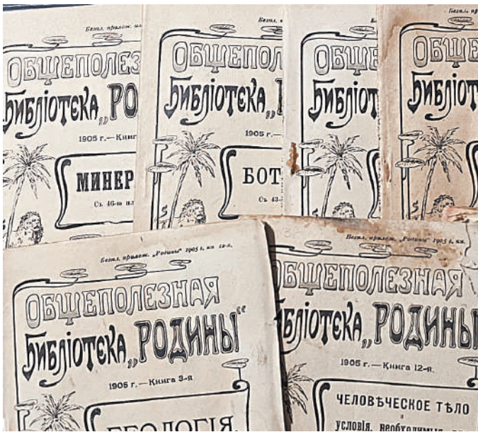
В 1891 году журнал «Родина» печатался тиражом сорок тысяч экземпляров.