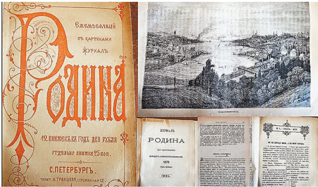
В XIX веке в журнале печатали повести и романы, советы по хозяйству, рецепты, были приложения для детей.