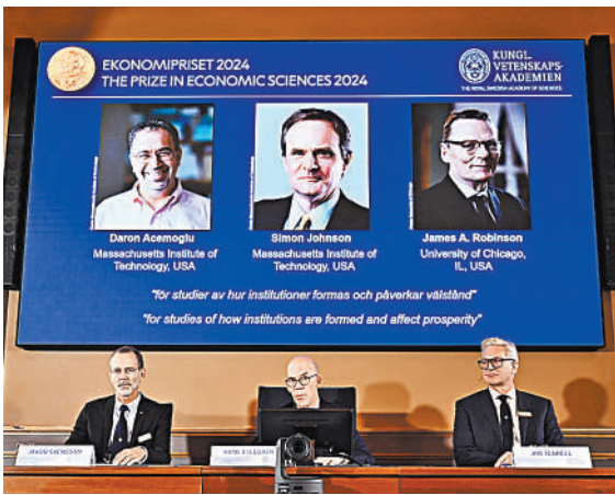
Все трое лауреатов премии представляют США.