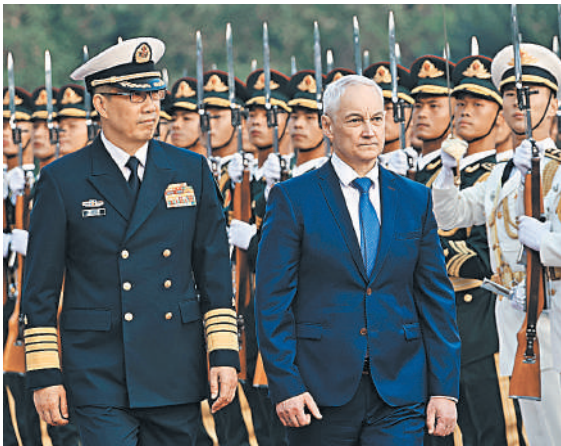
Министр обороны РФ Андрей Белоусов и министр обороны КНР адмирал Дун Цзянь обшли строй почетного караула.

По словам Андрея Белоусова, Москва и Пекин регулярно проводят совместную оперативную и боевую подготовку на суше, в море и в воздухе. И именно военное сотрудничество РФ и КНР является важным элементом повышения обороноспособности, поддержания глобальной и региональной стабильности, подчеркнул российский министр. По его словам, военные наших стран успешно обрабатывают учебно-боевые задачи, в том числе самой высокой сложности.