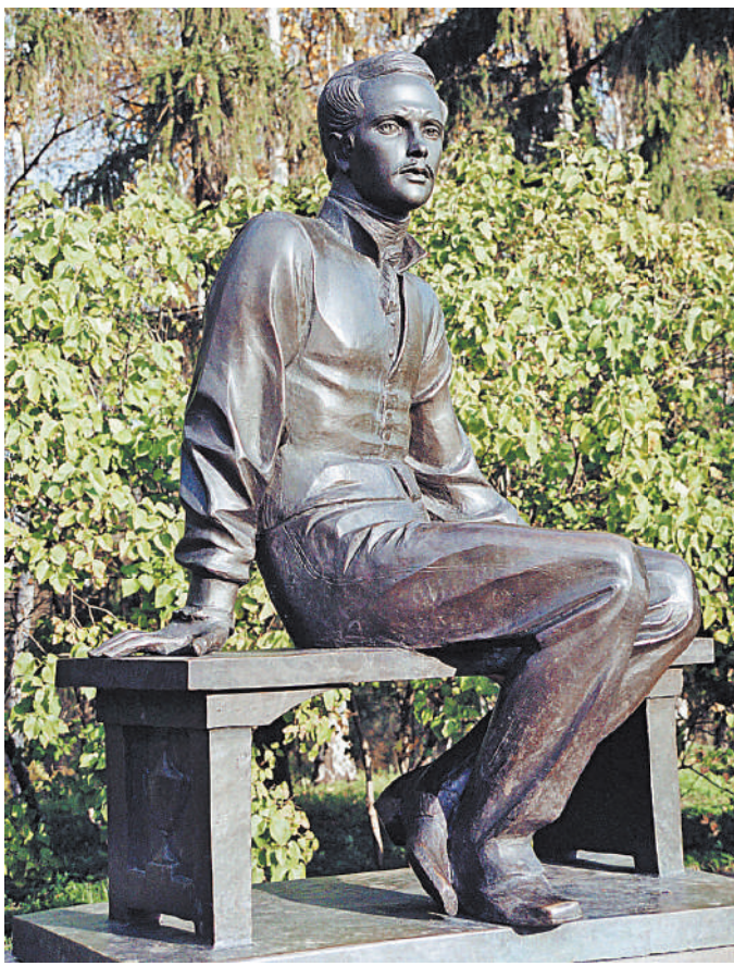
Памятник Михаилу Юрьевичу Лермонтову в Тарханах.