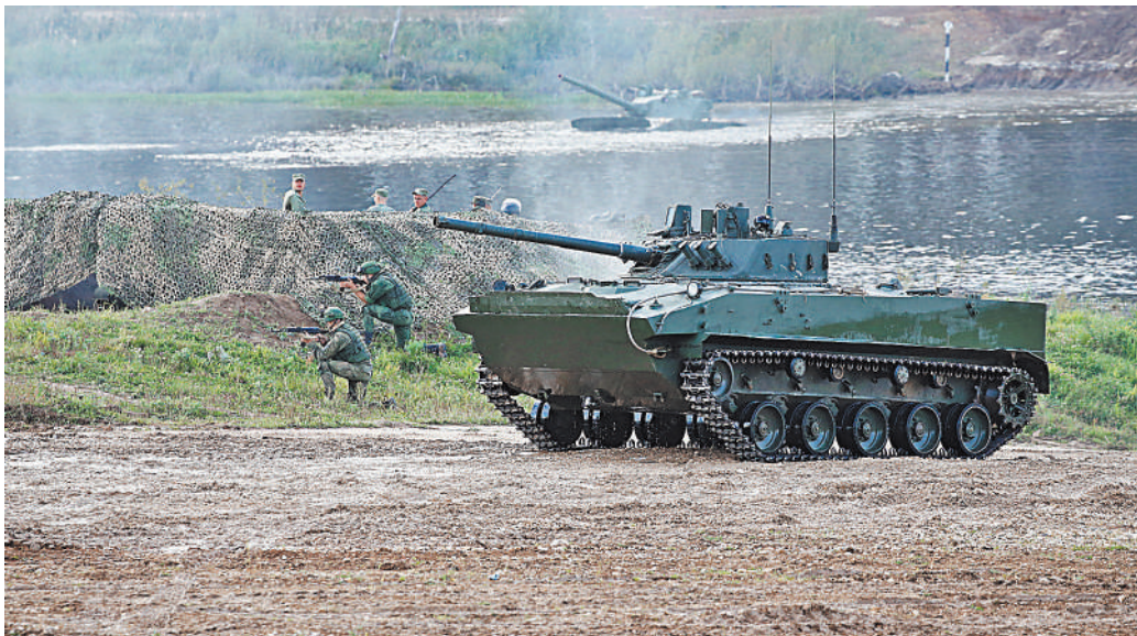
БМД-4М имеет мощное вооружение, а система управления огнем у этой бронемашин одна из лучших в мире.

— Бронежилет и каска у меня есть, старенькие, зато надежные. Но не всегда с броней удобно искать прячущихся людей, при этом ведь нужно быстро передвигаться. Попадал ли под обстрелы? Конечно. Бывали такие прилеты, что по звуку кажется, что летит точно в тебя, и слова молитвы сказать не успеваешь, думаешь вот вот на куски разорвет. Очень страшные каскетные боеприпасы. Сначала гремит взрыв в воздухе, а потом — снова серия разрывов поменьше. Один раз мы под такой обстрел попали в центре села, когда я сажал людей в машину для эвакуации. Еще был случай: в подвале прятались 16 человек, и я никак не мог вывезти всех сразу. Взял самых немощных, которые не могли идти. Остальных проинструктировал, как вести себя при обстреле, и предложил выходить на рыльскую трассу. Люди так и сделали, их забрали проезжающие военные попутчики. ●