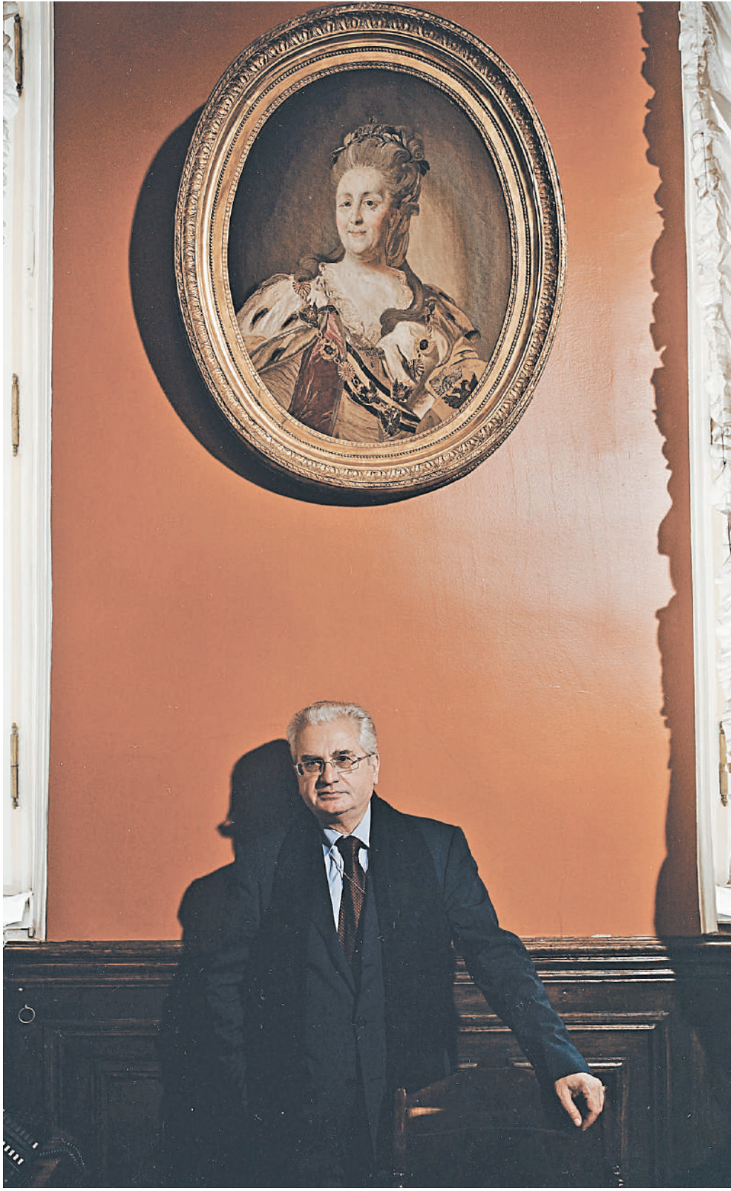
Михаил Пиотровский: В планах Эрмитажа — выставки в Екатеринбурге, Омске, Владивостоке в 2025 году.

Планы музея за пределами Петербурга также впечатляют. В культурно-просветительском центре «Эрмитаж — Урал» пройдет выставка «Охота — страсть и развлечение». В центре «Эрмитаж — Сибирь» осенью 2025 года откроется выставка «Пять символов счастья. Благопожелания в китайском искусстве XVII–XX