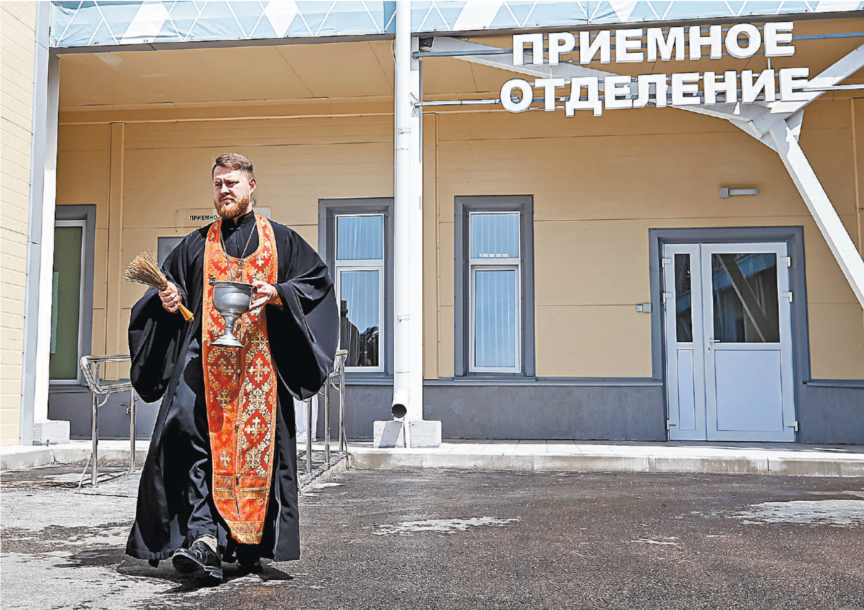
И сегодня священники приходят к пациентам в больницы, но правила таких визитов определяют местные власти и руководители медучреждений.