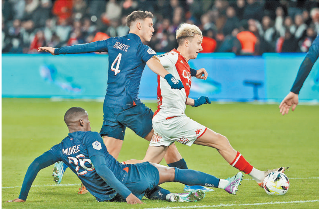
Дриблинг — одно из лучших качеств Александра Головина. На фото: россиянин изящно обыгрывает сразу двоих футболистов гранда французской лиги «Пари Сен-Жермен».

АЛЕКСАНДР ГОЛОВИН: Тяжелый вопрос. Наверное, его лучше задать тем, кто смотрит со стороны. Мне правда нелегко ответить. Я просто делаю свою работу — играю в футбол. Оценивать мой уровень должны другие люди.