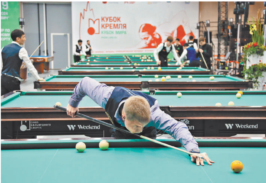
В отборочном раунде соревнований по пирамиде с рекордным за всю историю турнира количеством участников организаторы задействовали множество столов.

Все финальные поединки будут показаны в прямом эфире на телеканале «Матч! Игра» и в разных вариантах на федеральном «Матч! Страна» (режимы LIVE, премьерный показ или в записи). ●