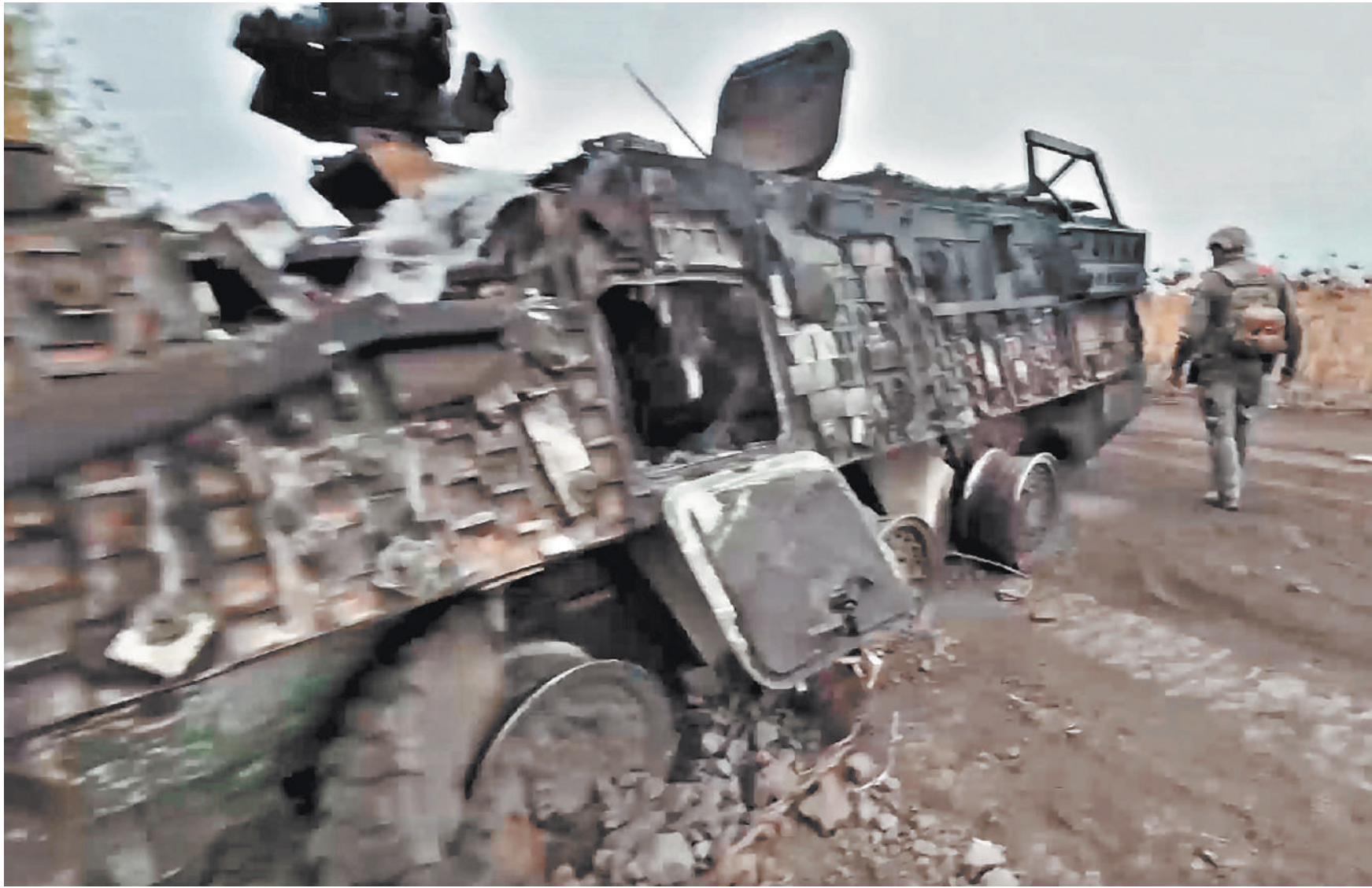
Военнослужащие бригады морской пехоты группировки войск «Север» продолжают успешно уничтожать вражескую технику и выбивать боевиков ВСУ из населенных пунктов Курской области.