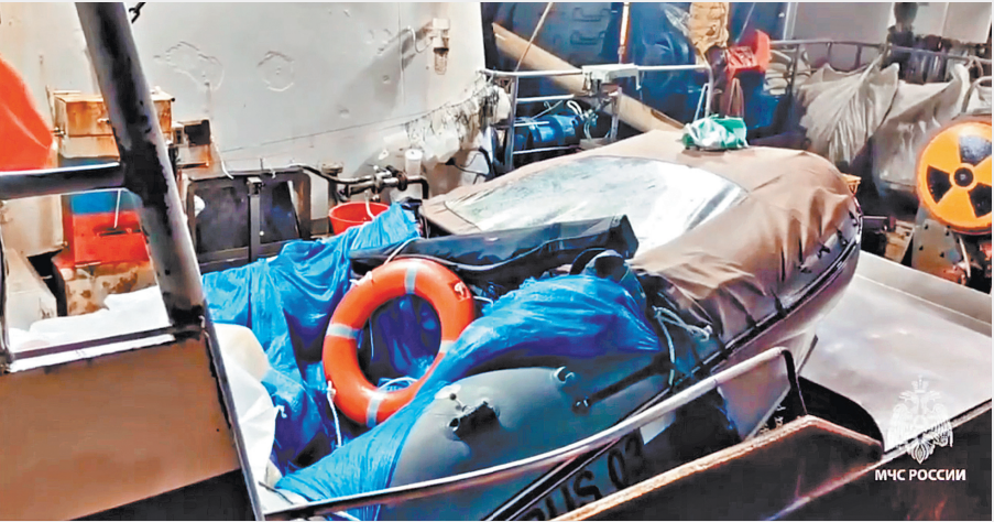
Два месяца это утлое суденышко, потерявшее управление, было предоставлено воле волн и ветра.

суд Завершено дело еще одного начальника из минобороны