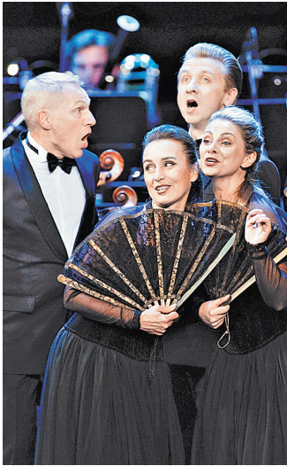
Все, кто выходил на сцену Большого в этот вечер, так или иначе связаны с именем Елены Образцовой.