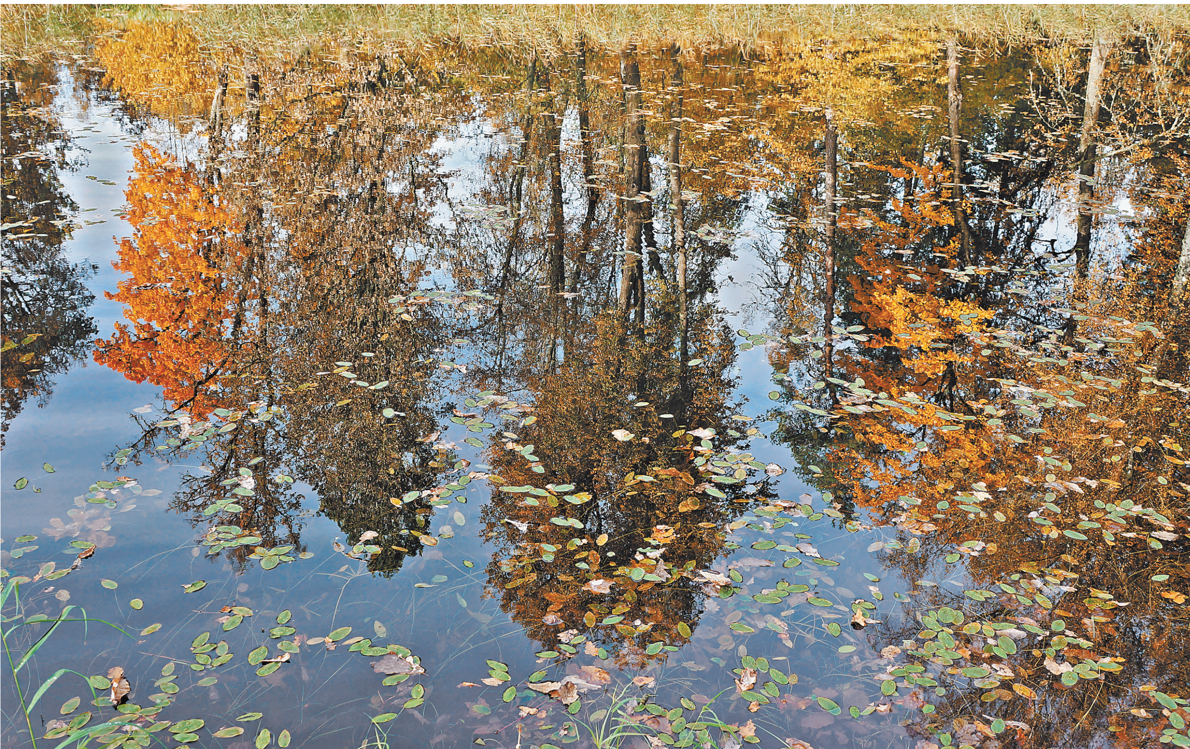
Пейзаж заповедника тоже воспитывает.