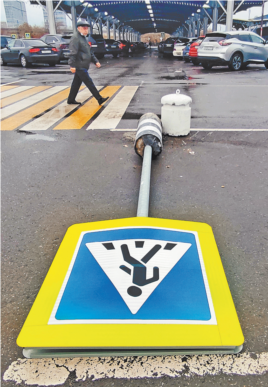
Только упавший знак или отсутствие разметки могут стать оправданиями для водителя при ДТП с пешеходом.

Но в данной истории важно другое. Судами низших инстанций было установлено, что автомобиль двигался с превышением скорости. Причем