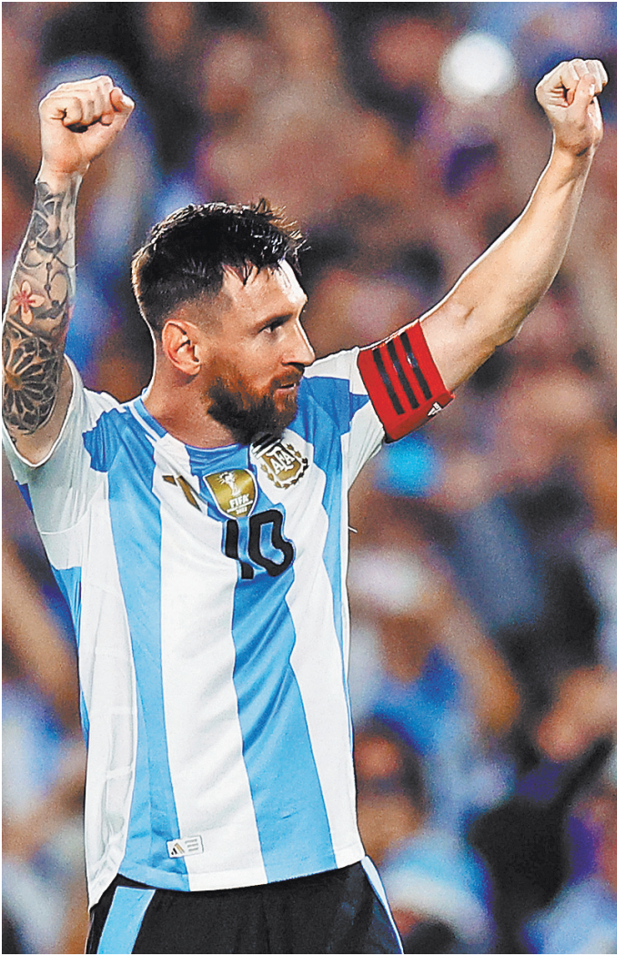
Пока аргентинец Лионель Месси совершает бомбардирские подвиги в сборной, француз Килиан Мбаппе то и дело попадает в разные скандалы.