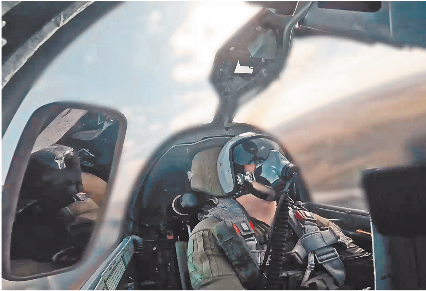
Экипажи штурмовой авиации на боевых самолетах Су-25 накануне сорвали ротацию подразделений ВСУ в приграничном районе Курской области.