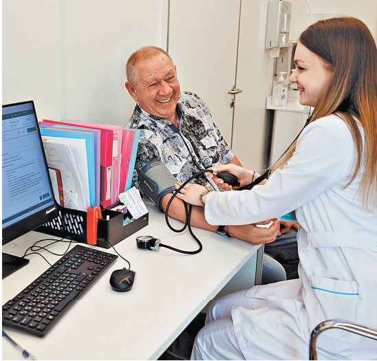
Доказывать в суде, что лечение проводилось правильно, обязаны не родные больного, а медицинское учреждение.

Материалы этого спора внимательно изучили в Судебной коллегии по гражданским делам Верховного суда РФ. И не согласились с решением своих коллег. В итоге ВС этот спор пересмотрел и указал на главную ошибку: местные суды возложили бремя доказывания обстоятельств, касающихся некачественного оказания мужчине медицинской помощи и причинно-следственной связи между этим событием и смертью паци-