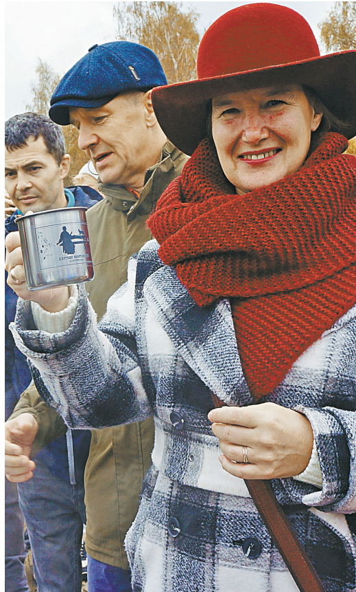
Чашка глинтвейна за няню.