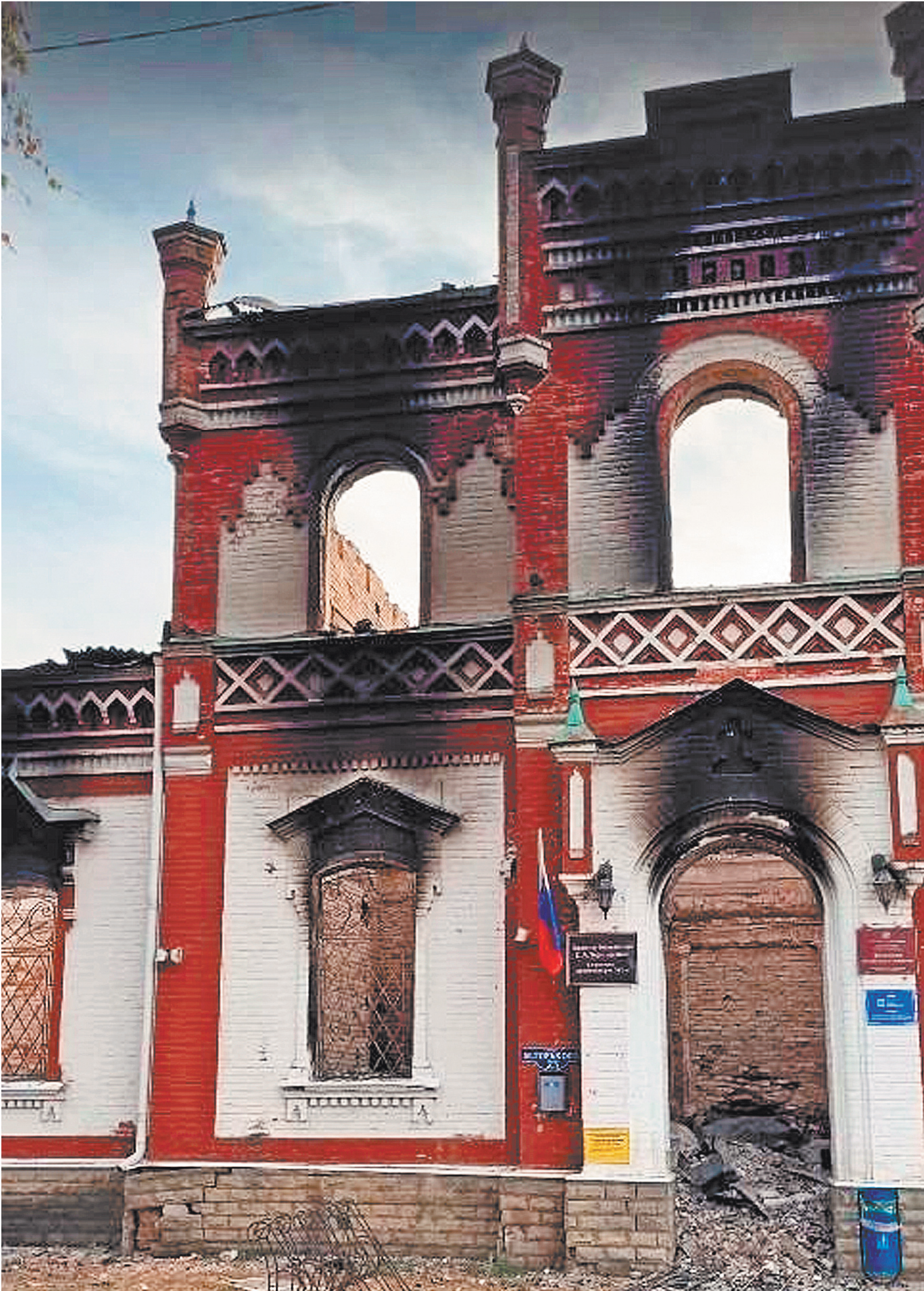
От Глушковского краеведческого музея после фашистских обстрелов остались только обожженные стены и пустые окна.

Знаете, мы почему-то не верили до последнего. В 2022 году мы встречали наших воинов, ехало много техники. Шум такой в поселке. Стояли на мосту, не спали, встречали и махали им. А потом... Глушково обстреливалось и в прошлом году, и рядом с музеем падали снаряды. Я по утрам обычно бегала в парк на зарядку, в речке балала — а тут вдруг пролетел снаряд. Бегом оделась, уже в парке второй снаряд упал, можно сказать, в 50 метрах. Машинально, как учили когда-то в школе