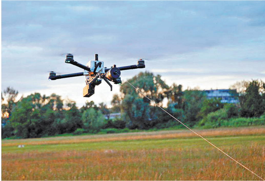
Дрон, управляемый по проводам, — настоящее открытие в летающей робототехнике. И это наше изобретение.

— Читайте также: новый «Калашников» испытан на передовой. В чем его особенность? rg.ru/art/2927153