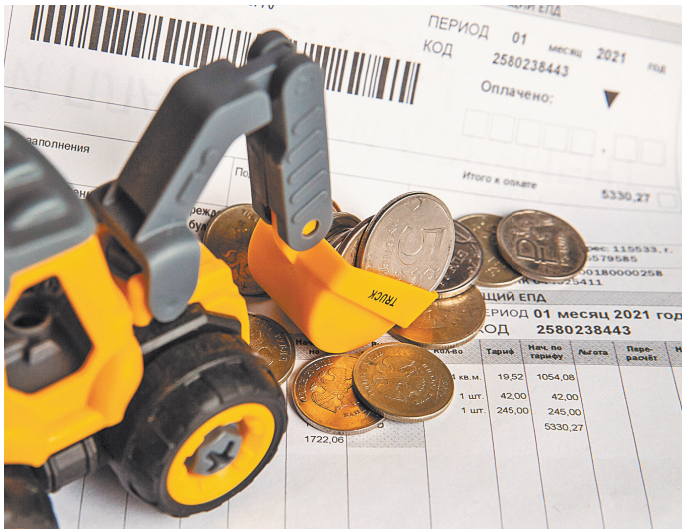
Если управдомы довели человека до суда, счета к ним возрастают.

Отделение Верховного суда РФ № 48-КГ19-9.