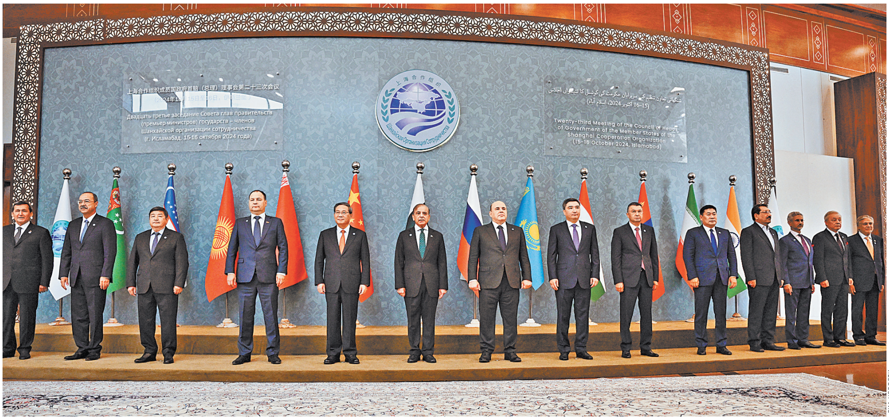
Церемония фотографирования перед началом заседания Совета глав правительств ШОС.

На этих и других направлениях работы ШОС сконцентрируется под председательством России в Совете глав правительств. Оно перешло Москве после саммита в Исламабаде. «Считаю, что у ШОС есть все возможности, чтобы стать одним из мощных центров справедливого многополярного мира, который сейчас формируется, и мы вместе способны это обеспечить — для экономического процветания наших стран и роста благосостояния граждан», — заключил Мишустин. ●