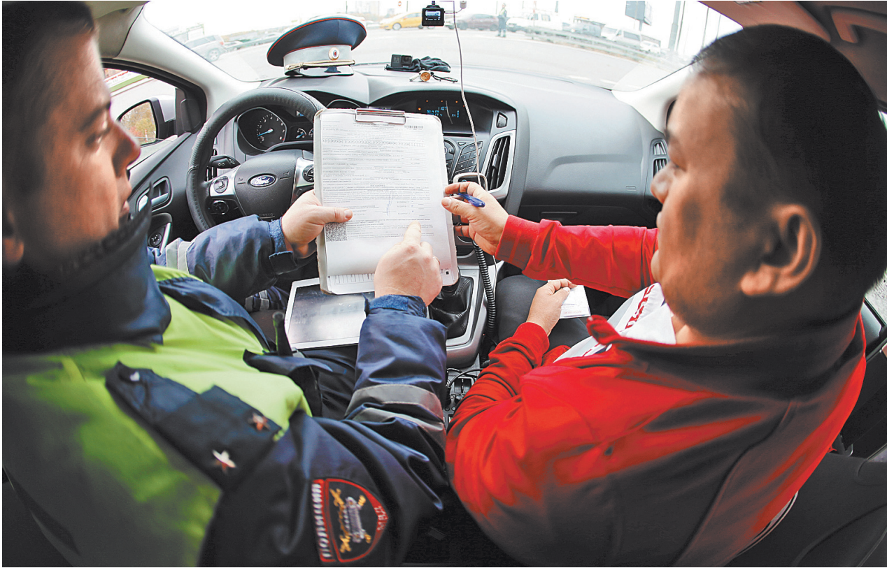
У водителей есть шанс получить еще один день для обжалования решения автотранспортного инспектора.

Осталось только дожидаться, когда закон подпишет президент. ●