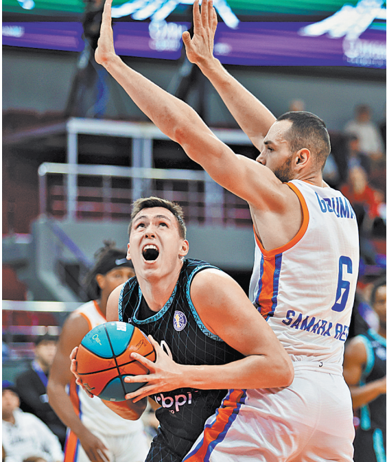
Нижегородцы (в темной форме) сильные, когда в составе нет травмированных. В прошлом сезоне лазарет был переполнен.

Вчерашние встречи «Енисей» (Красноярск) — «Парма» (Пермь) и «Локомотив-Кубань» — «Уралмаш» завершились уже после подписания этого номера «РГ». ●