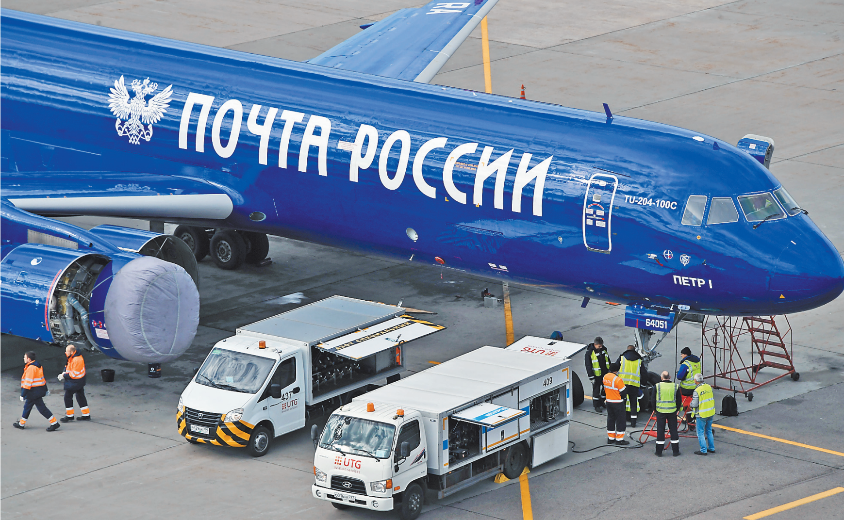
В год «Почты России» доставляет более 2 млрд бумажных отправок и около 200 млн посылок. Оптимизировать маршруты помогает цифровое моделирование.

Михаил Волков: Наш ключевой вызов состоит в том, что 70% выручки приходится на падающие рынки. К ним, например, относятся доставка писем, газет. Вы только представьте: в год мы доставляем более 2 млрд бумажных отправок и при этом менее 200 млн посылок. То есть абсолютное большинство мощностей задействованы на снижающихся рынках. Преодолеваем такую неэффективность. Одно из решений — перевод квитанций,