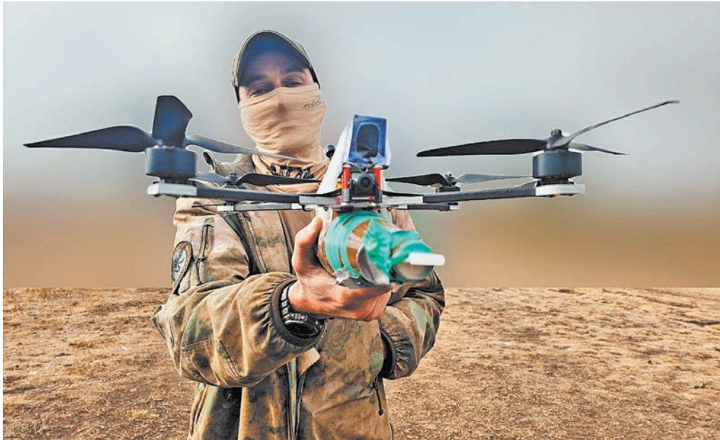
По словам военных, дроны в последнее время по своей эффективности начали превосходить даже артиллерию.

Также инструктор говорит, что ВСУ пытаются применять разные хитрости как при запуске дронов, так и в случаях, когда беспилотник удается уничтожить. «Сбили мы с напарником тяжелый дрон «Баба-Яга». Он падает. Мы довольны. И тут по нам начинает лететь со всех сторон. Минуты не прошло. Окажется, противник устанавливает на такие беспилотники специальные датчики, которые при падении выдают координаты места. Хорошо, мы не пошли