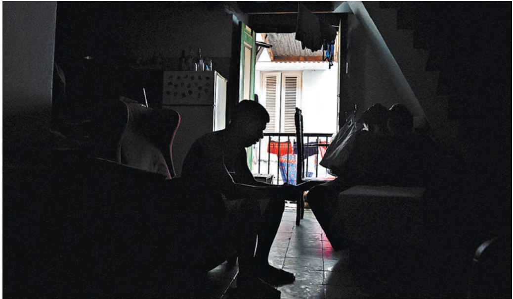
В домах жителей Гаваны и других кубинских городов света не было более суток.