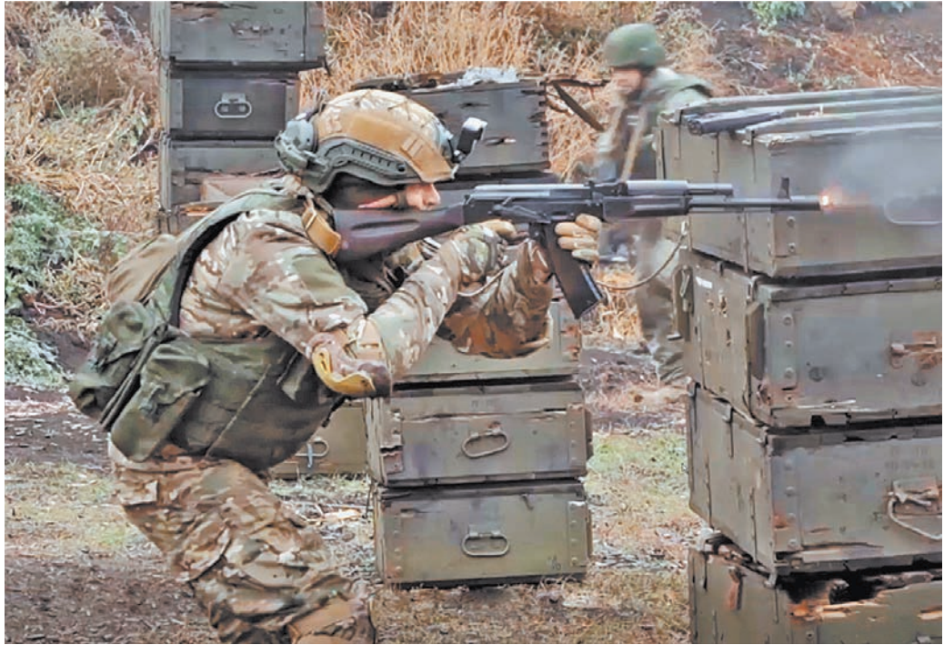
Бойцы добровольческих отрядов «БАРС» в первую очередь обучаются огневой подготовке на полигонах.

В то же время с 1 октября уже подготовленные «барсовцы» приступили к выполнению служебных обязанностей. И есть уже первые успехи. «В Шебе-