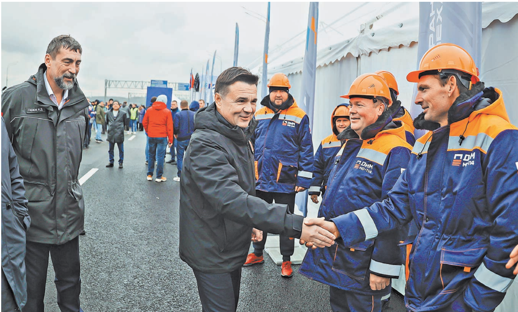
Андрей Воробьев не жалеет добрых слов для дорожных строителей, которые трудятся на объектах практически круглосуточно.

СКОРОСТЬ Губернатор Андрей Воробьев: До конца года сдадим еще несколько новых дорог