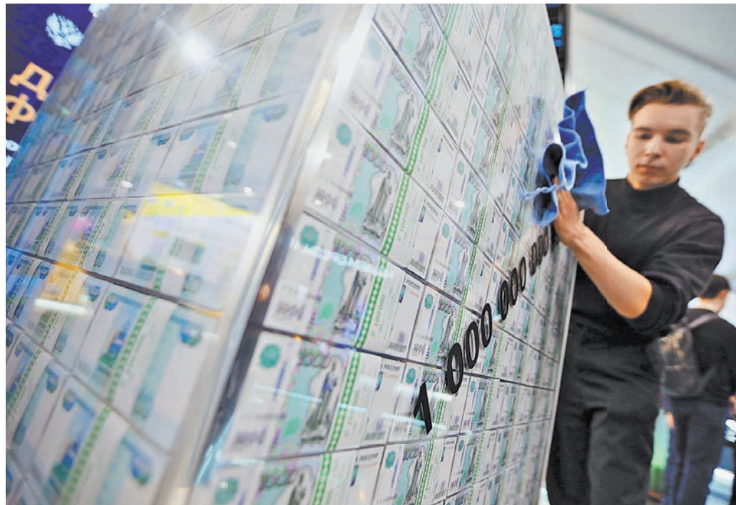
Хранить сбережения в наличных невыгодно из-за инфляции, говорят эксперты и советуют открывать вклады.