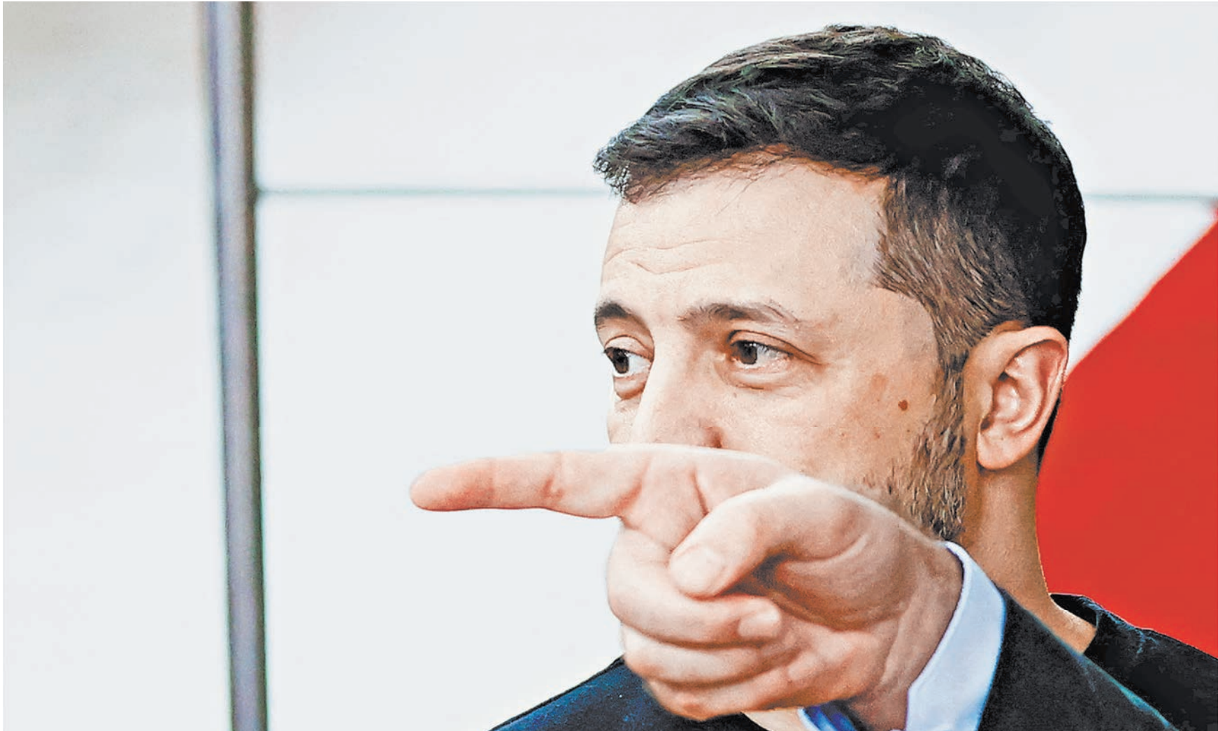
Владимир Зеленский постучал в закрытые двери НАТО ядерным шантажом. Но ему не раз указывали, что Украина для альянса не равноправный партнер, а инструмент.

Но легкомысленно относиться к таким угрозам не стоит. Возможно, в этом шантаже есть завуалированный намек на готовность киевского режима