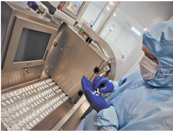
У производителей есть и свои научные лаборатории, так что вся работа — от идеи до таблетки — идет в одном месте.