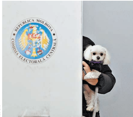
Власти Молдавии всеми силами тащат ее граждан на европейскую орбиту, игнорируя мнение оппонентов.

Главным оппонентом Санду эксперты называют бывшего генпрокурора Александра Стояногло, выдвинутого Партией социалистов Молдавии. После голосования он заявил, что отдал свой голос «за мир, за стабильность, за дружбу разных представителей национальностей, которые живут в Молдавии». Стояногло подчеркнул, что выступает за «баланс в отношениях с зарубежными партнерами, в том числе с Россией».