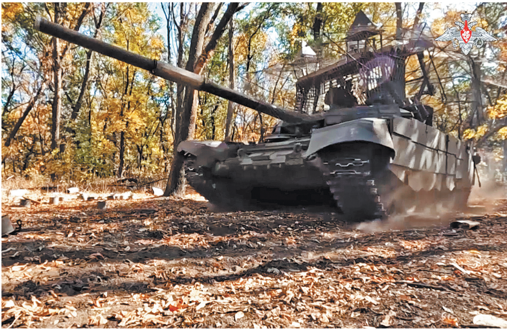
Экипажи танков Т-72Б3 группировки войск «Юг» поддержали наступление штурмовиков на Кураховском направлении. Машины работают и прямой наводкой, и с закрытых огневых позиций.