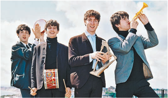
Фильм дает редкую возможность заглянуть в то время, когда The Beatles были самой влиятельной группой.

Новый фильм расскажет о первых гастрольях The Beatles по США, состоявшихся в 1964 году. Его спродюсерами стали Пол