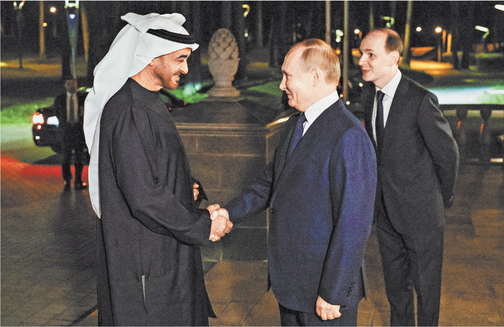
Владимир Путин приветствовал Мухаммеда Бен Заид Аль Нахайяна в своей резиденции «Ново-Огарево».

На переговорах будут рассмотрены перспективы развития российско-эмиратского сотрудничества, актуальные вопросы международной повестки дня, включая ситуацию на Ближнем Востоке и в Северной Африке. Затем гостя ждет Казань — президент ОАЭ примет участие в саммите БРИКС. ●