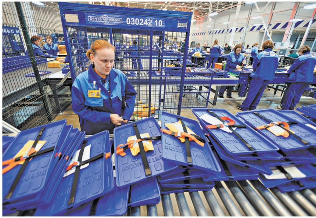
Ожидается, что к концу года более 50% всех посылок физлиц будут оформлять в электронном формате.

США и ЕС ввели санкции против всех запланированных и строящихся российских СПГ-проектов. Ограничения коснулись не только компаний-операторов, но и сделали невозможными новые инвестиции в проекты, а также предоставление любых товаров, технологий и услуг для них. В том числе они сделали невозможной передачу «Арктик СПГ-2» сделанных в Южной Корее газовозов ледового класса Arc-7. На заводе была запущена первая линия, но вывозить продукцию оказалось нечем. ●