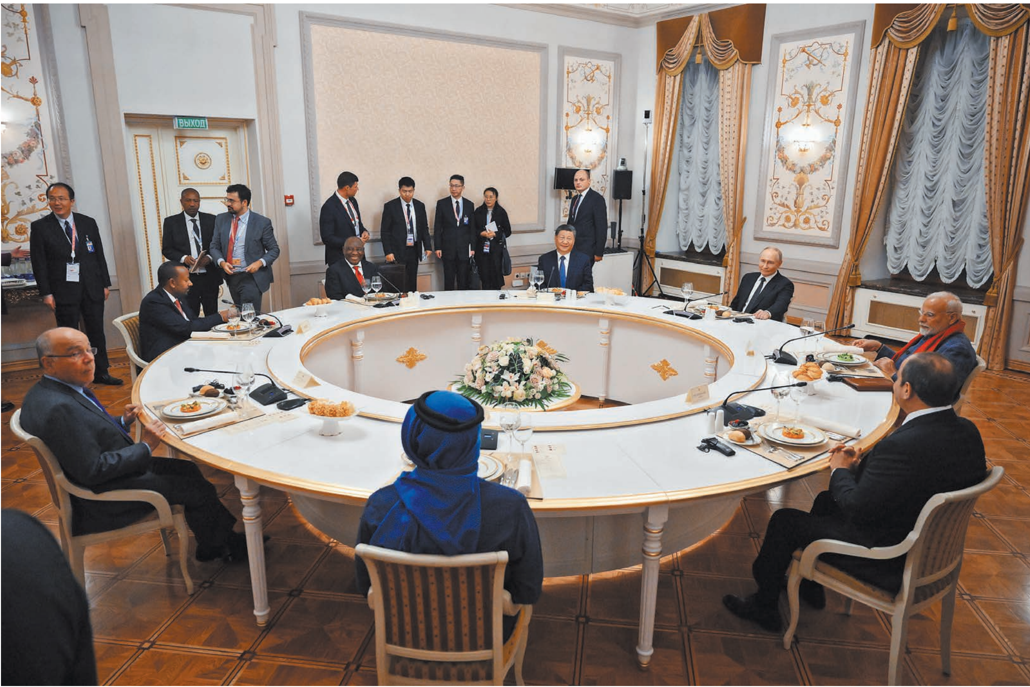
Главы делегаций стран БРИКС собрались в Казани за дружеским ужином.

Кроме того, укрепляются гуманитарные связи, растут туристические потоки, спортивные и образовательные обмены. В частности, президент рассказал, как много туристов из КНР видит в Московском Кремле. «Я вот вчера только по Кремлю передвигался, наблюдаю, как и обычно в последнее время, месяцы и годы, большое количество китайских туристов приезжает в сердце России, в Москве, в Кремле», — сообщил Путин.