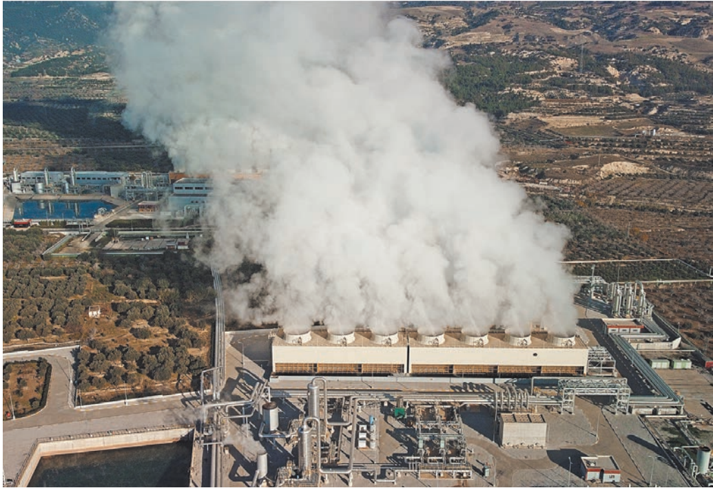
Геотермальная энергетика активно развивается во всем мире, но в России пока недооценена.

недооценен, геотермальная энергетика не вошла в программы поддержки, действующие с прошлого десятилетия на различных (кроме изолированных энергосистем) и оптовом энергорынке, где основной акцент сделан на ветровой и солнечной энергетике. В основном это связано с тем, что геотермальные проекты плохо тиражируемы и капиталоемки. Но нельзя исключать, что в отдельных регионах, в частности при ее интеграции в системы теплоснабжения, геотермальная энергетика может оказаться оптимальным решением. ●