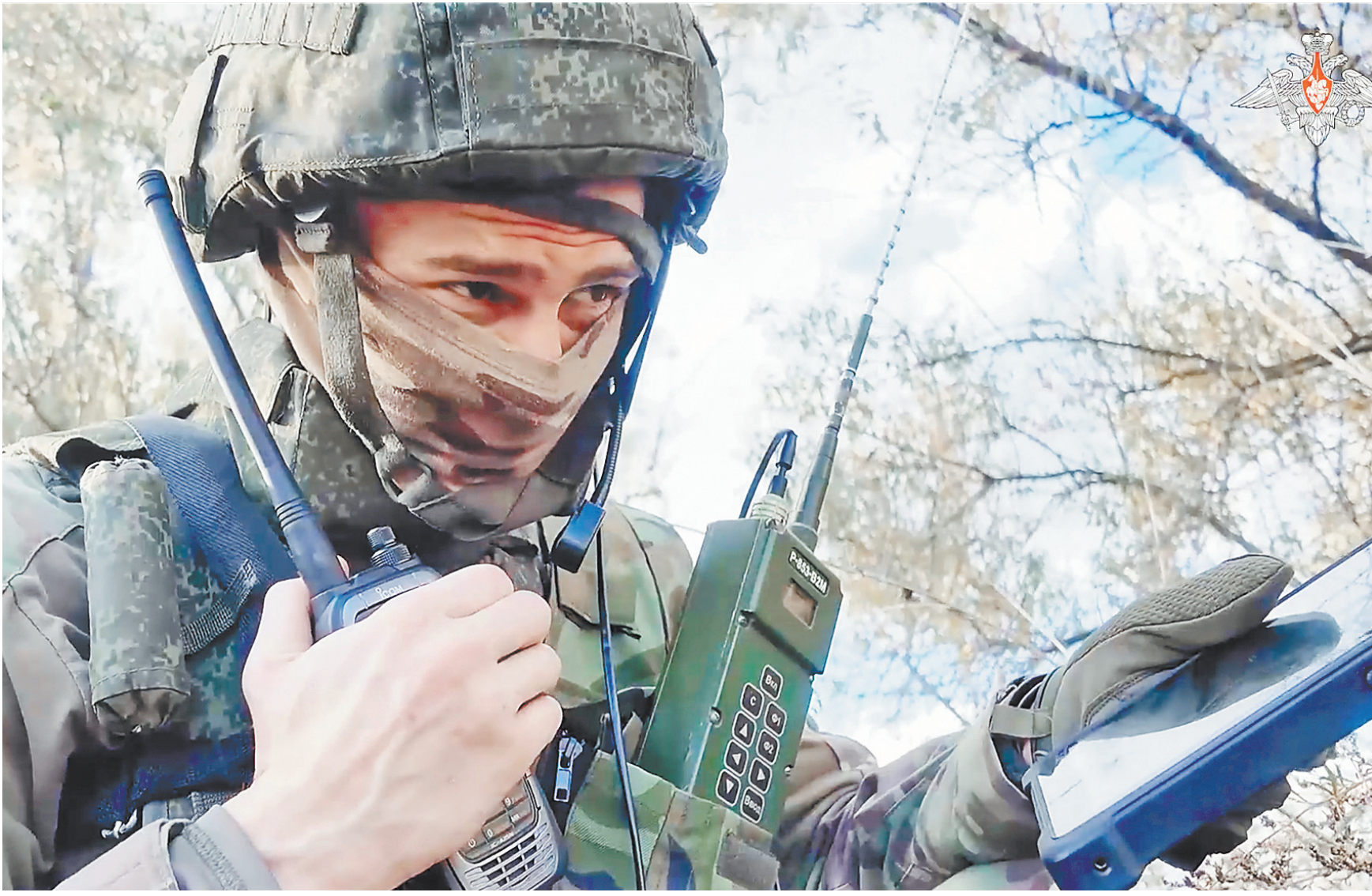
Авианаводчик Новороссийского горного соединения ВДВ определил ориентиры для нанесения авиаудара по целям ВСУ. После экипажи вертолетов Ка-52 и штурмовиков Су-25 отработали по ним.