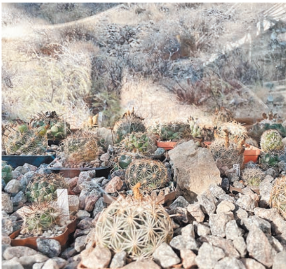
На выставке представлены кактусы, выращенные коллекционерами в Москве и Подмосковье.

Около 400 видов кактусов можно увидеть в «Аптекарском огороде»