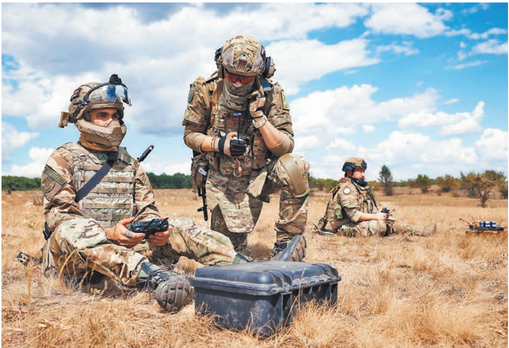
Бойцы с помощью FPV-дронов «Князь Вандал Новгородский» уничтожают танки ВСУ, вторгшиеся в Курскую область.

Первым кумулятивным выстрелом, разработанным специально для РПГ-7, стал ПГ-7В массой около 2 кг. В последующем он неоднократно модернизировался, но конструктивно остался прежним. Головная часть имеет корпус с коническим обтекателем, прикрывающим заряд взрывчатого вещества с кумулятивной воронкой.