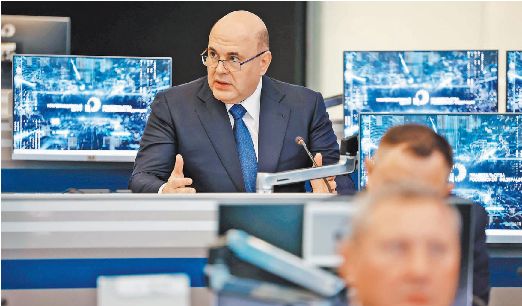
Михаил Мишустин сообщил, что утвержден перечень из 16 опорных населенных пунктов макрорегиона.