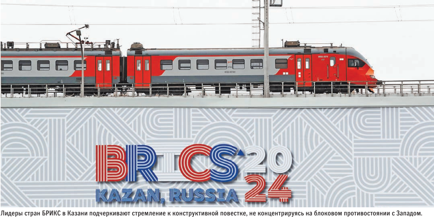
Лидеры стран БРИКС в Казани подчеркивают стремление к конструктивной повестке, не концентрируясь на блоковом противостоянии с Западом.

«Мы с нетерпением ждем Казанского саммита, который напишет новую главу единства и развития для Глобального Юга», — говорится в редакционной статье китайской Global Times. ●