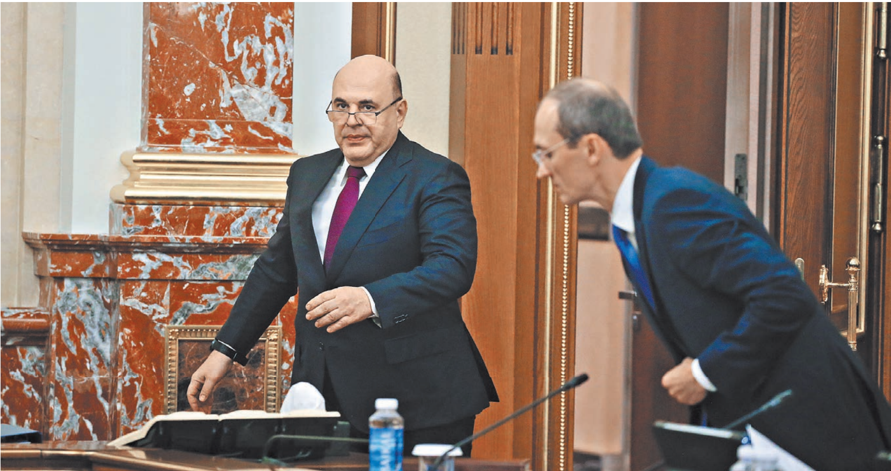
Михаил Мишустин: Важно совершенствовать систему государственной поддержки, ориентируясь при этом на обратную связь от людей.

сообщил о дополнительном решении по Белгородской, Брянской и Курской областям, в которых по-прежнему приходится оперативно реагировать на все возникающие вопросы, пока жители и бизнес граничащих с Украиной территорий нуждаются в поддержке. Ранее туда были направлены средства на выплаты за утерю имущества, запущен механизм свободной экономической зоны на отдельных территориях для частных компаний, чтобы они могли пользоваться льготами по налогам на прибыль, на имущество и страховые взносы.