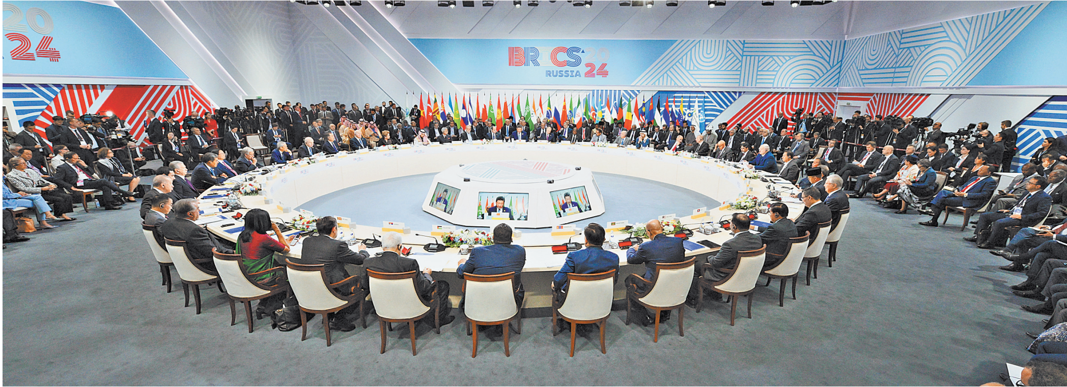
За общим столом в Казани собрались руководители стран Европы, Азии, Африки и Латинской Америки.

нерами на международных площадках — в ООН и на «двадцатке» схожих нарративов, призванных, по словам министра иностранных дел Индии, «убрать перекося, ставшие следствием старой колониальной эпохи». Программным выглядело на саммите выступление главы Беларуси Александра Лукашенко. Он перечислил по пунктам, что в деятельности БРИКС может проявить Минск: «опыт, как стать сильнее самим и делать сильнее других». Речь идет о помощи, которую Беларусь готова оказать БРИКС в вопросах безопасности, устойчивого экономического развития, борьбе с голодом и изменениями климата, в гуманитарной сфере. Беларусь рассматривается в качестве первоочередного кандидата на статус партнера, а в перспективе — и члена БРИКС. Во время заседания «БРИКС плюс» телекамеры выхватывали знакомые картины происходящего в зале. Вот премьер Армении Никол Пашинян, оказавшийся по соседству с президентом Азербайджана Ильхамом Алиевым, что-то с ним эмоционально обсуждает. Или сидящие рядом Владимир Путин и Си Цзиньпин оживленно общаются через переводчика, после чего энергично пожимают друг другу руки. Глава КНР уже улетел из Казани, тепло попрощавшись в аэропорту с руководителем Татарстана Рустамом Миннихановым. СМИ цитируют слова товарища Си: «Татарстан — замечательное место. Спасибо. Давайте почаще общаться!».