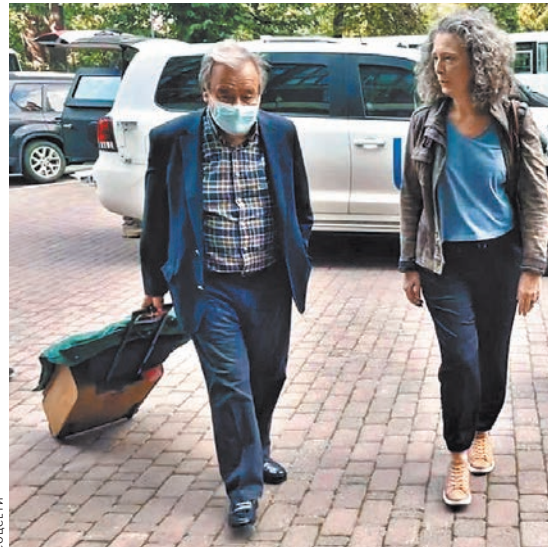
Антониу Гутерриш во время визита в Киев в 2022 году. Теперь Киев указывает Генсеку ООН, куда ему ездить, а куда—нет.

Однако это далеко не первый раз, когда подопечные американцев с их молчаливого согласия открыто бьют по всемирной организации и ее генсеку. Совсем недавно Израиль объявил Гутерриша персоной нон грата. Нельзя исключать, что по этому пути пойдет и Киев.