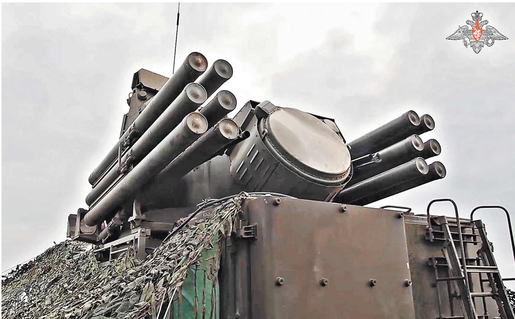
Расчеты зенитных ракетных пушечных комплексов «Панцирь-С» круглосуточно несут боевое дежурство в курском приграничье, сбивая любую воздушную цель, летящую со стороны позиций ВСУ.