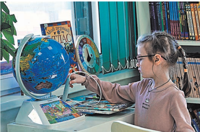
На фестивале семейного чтения пройдут мастер-классы и лекции.

Какой социальной сети 450 миллионов лет? Что делать, если праздник безнадежно испорчен, и можно ли его «починить»? Как не перепутать реальную жизнь с виртуальной? И самое главное — что починить детям? На эти и многие другие вопросы найдутся ответы на #ЧитайФесте, который в этот раз будет приурочен к Году семьи в России.