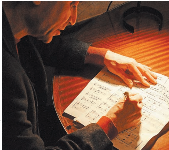
Композитор Владимир Баскин — автор десятков мюзиклов, от «Женитьбы Бальзамина» до «Великого Гэтсби»...

ВЛАДИМИР БАСКИН: Хотели напомнить, что наряду с итальянским театром дель арте в России был свой «театр масок». Практически каждое новое сочинение русских писателей рождало своих персонажей, многие становились нарицательными: скалозубы, молчалины, репетитовы, недоросли, фамусовы, хлестаковы, чичиковы, нодрёвы, маниловы, обломовы, плешкины, башмачкины... Фантастическая галерея сатирических образов! Поэтому героев Грибоедова мы постараемся показать сочно, колоритно. Текст гениален, и мы к нему отнеслись деликатно, сохранили крылатые выражения и всю палитру смыслов, заложенных в комедии. Далее — выбор режиссера.