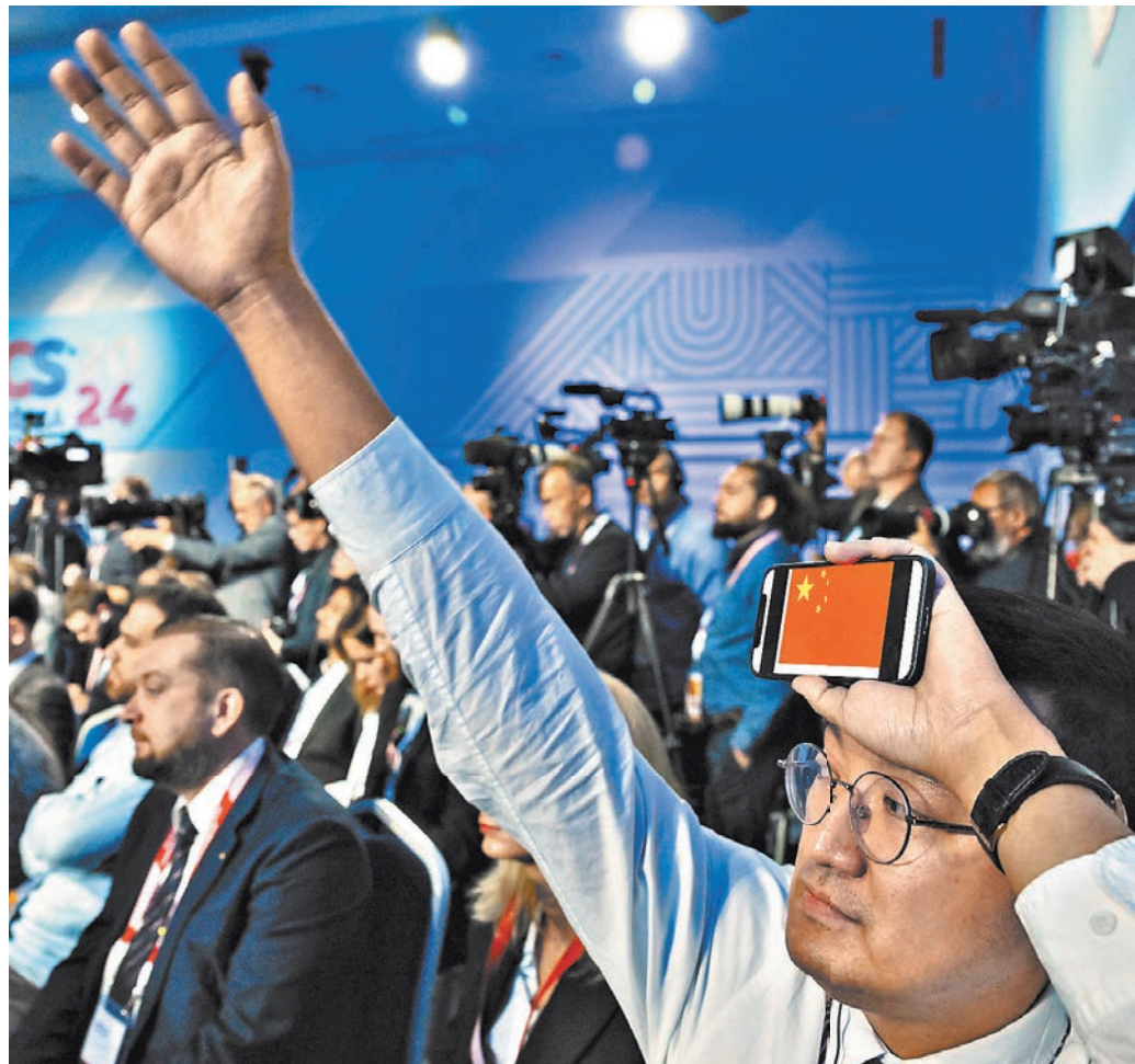
В целом Путин считает, что украинская атака на Курскую область является попыткой Киева вмешаться в выборный процесс в США. «Они хотят во что бы то ни стало показать действующей администрации и избирателям действующей администрации, этой партии, что их вложения в Украину были напрасными. Во что бы то ни стало и любой ценой. В том числе и ценой жизни своих солдат. На них работают, а не на интересы украинского народа», — пояснил глава государства.

Путин при этом подчеркнул, что Россия благодарна президенту Турции Реджепу Тайипу Эрдогану за площадку для переговоров с Украиной в 2022 году, отметив, что за счет этого удалось тогда выйти на «возможный документ, проект мирного соглашения».