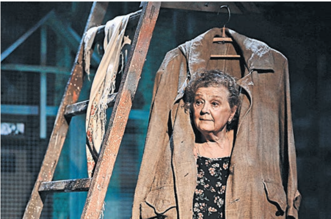
Алина Покровская — большая актриса, сумевшая сохранить не только высочайшее мастерство, но и достоинство.