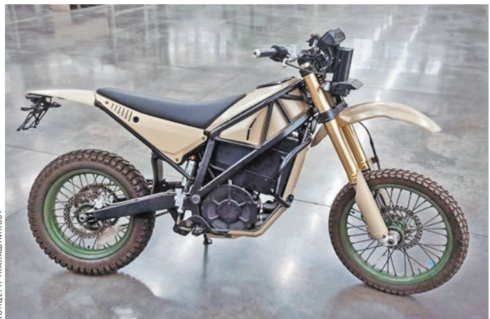
Электрические мотоциклы отличаются отсутствием теплового излучения.

Уточняется, что в испытаниях участвуют представители заказчика. «В процессе тестирования специалисты концерна уточняют пожелания пользователей, при выявлении технических недостатков оперативно проводят необходимые доработки»,— заключили в концерне. Ранее в минобороны сообщали, что стали активно применять мототехнику для штурмов позиций ВСУ. ■