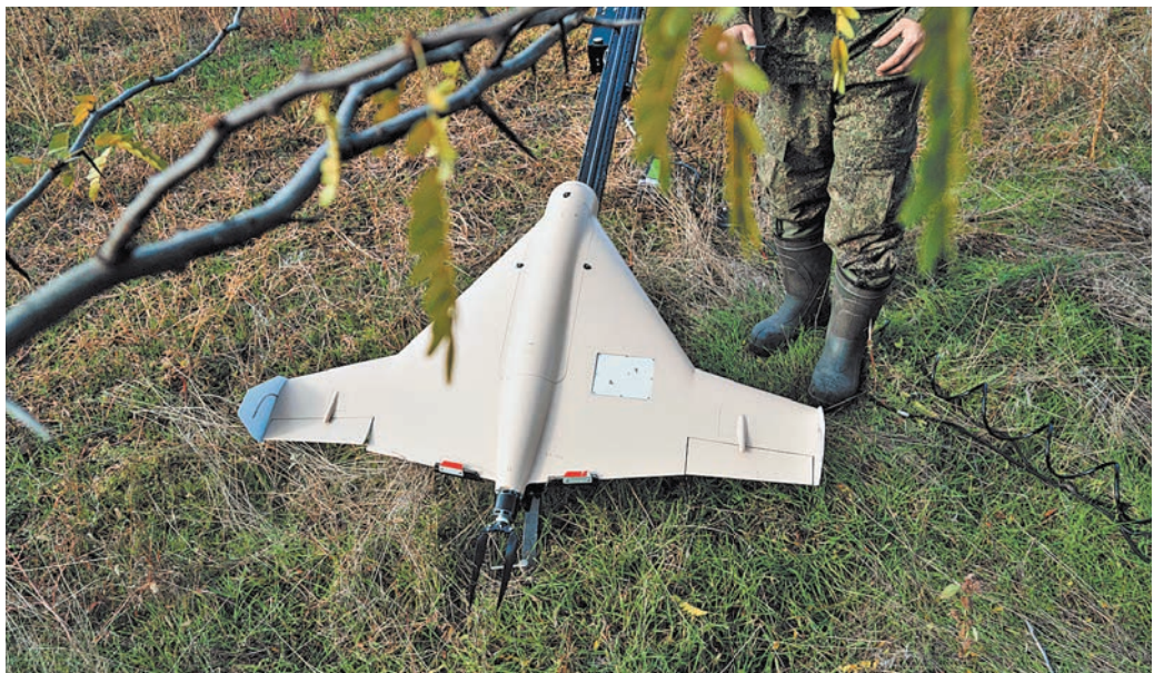
Военные применяют ударные беспилотники «КУБ» для уничтожения боевой техники и складов с боеприпасами ВСУ.

На днях концерн «Калашников» (входит в госкорпорацию «Ростех») сообщил, что впервые поставит зарубежному заказчику управляемые боеприпасы (УБ) «КУБ-Э». Первый экспортный контракт подписан АО «Рособоронэкспорт».