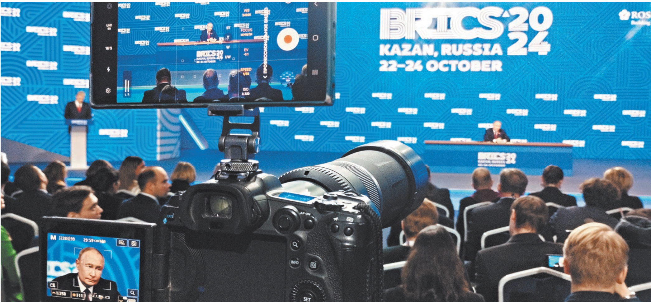
На саммит в Казани было аккредитовано около двух тысяч журналистов из самых разных стран мира. На пресс-конференцию Владимира Путина попали самые упорные.

«Если кто-то хочет возобновить с нами отношения — пожалуйста, мы же все время об этом говорим, но не навязываемся», — заявил на пресс-конференции президент Российской Федерации. ■