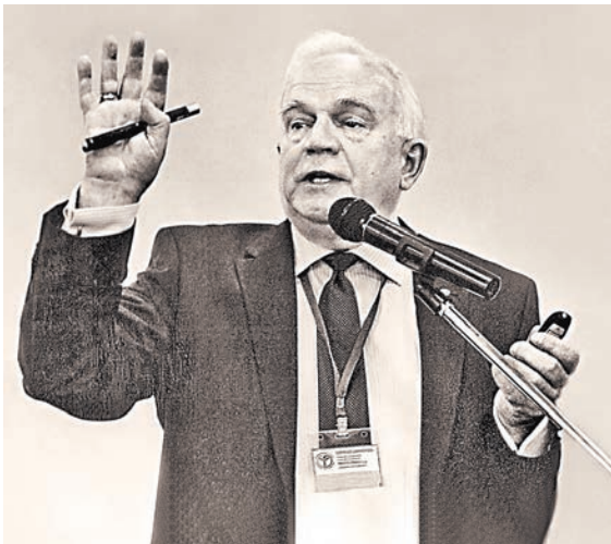
Иммунная система, говорит академик Черешнев, это «служба охраны» и регулятор жизненных процессов в организме.

—Это договор о мирном сосуществовании между человеком и природой. А в более узком смысле — между организмом и иммунной системой, которая стоит на страже постоянства внутренней среды организма. Но поскольку мы еще берем во внимание главный патологический процесс — воспаление, отвечающий на все и лежащий в основе многих заболеваний мозга, печени и так далее, то мы говорим, что иммунитет для того и существует, чтобы реализовывать себя через воспаление.