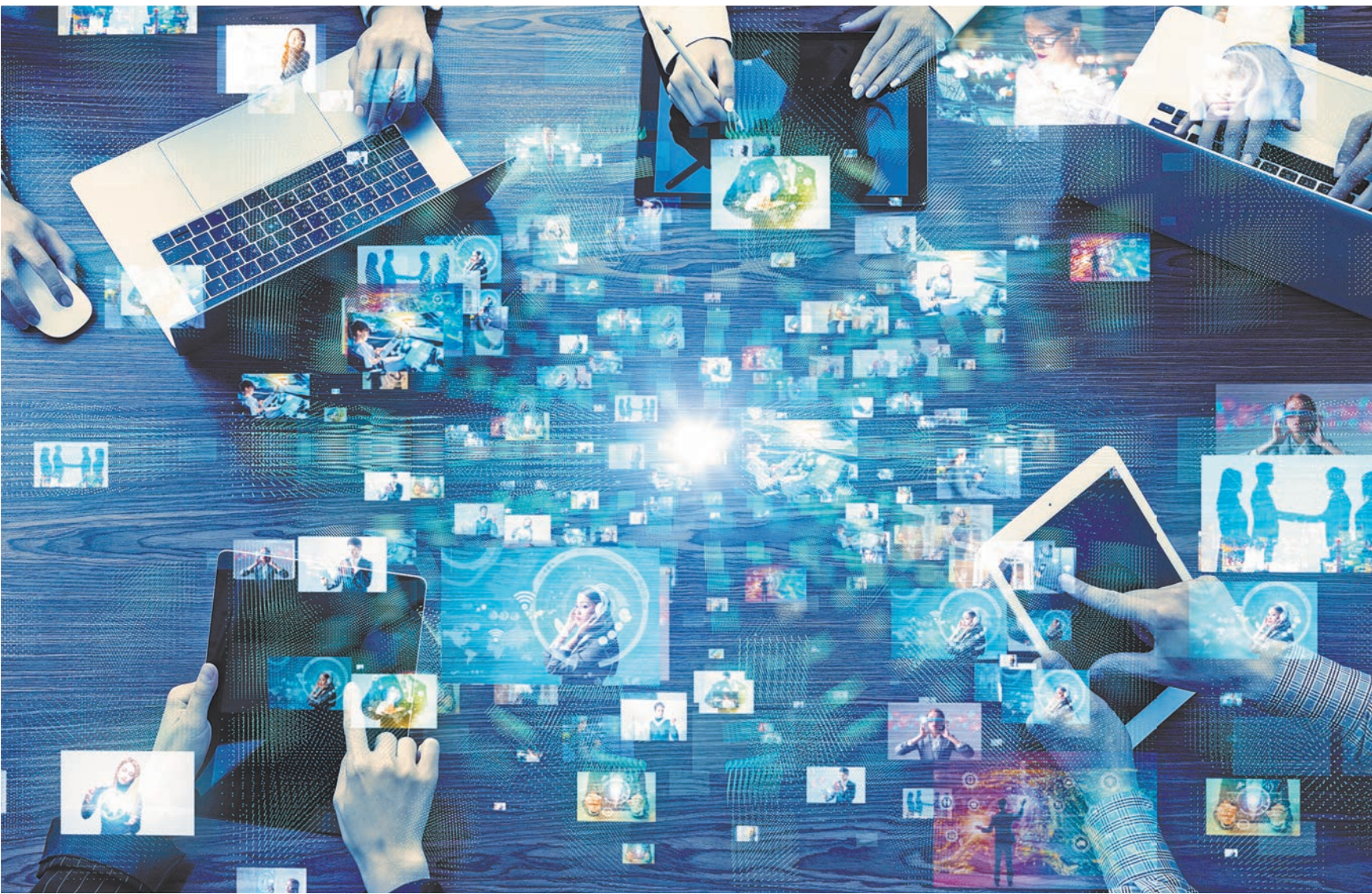
Новые требования для крупных каналов в соцсетях направлены на борьбу с анонимностью, которая развязывает руки преступникам.

В сентябре порядок оформления субсидии был упрощен — теперь достаточно подать заявление на ее получение, а остальные документы (за редким исключением) органы власти запросят самостоятельно через систему электронного взаимодействия с коллегами.