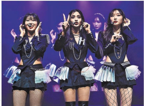
В названии группы X:IN отражено стремление собрать все, что нельзя описать словами, что-то новое, не такое, как у всех.