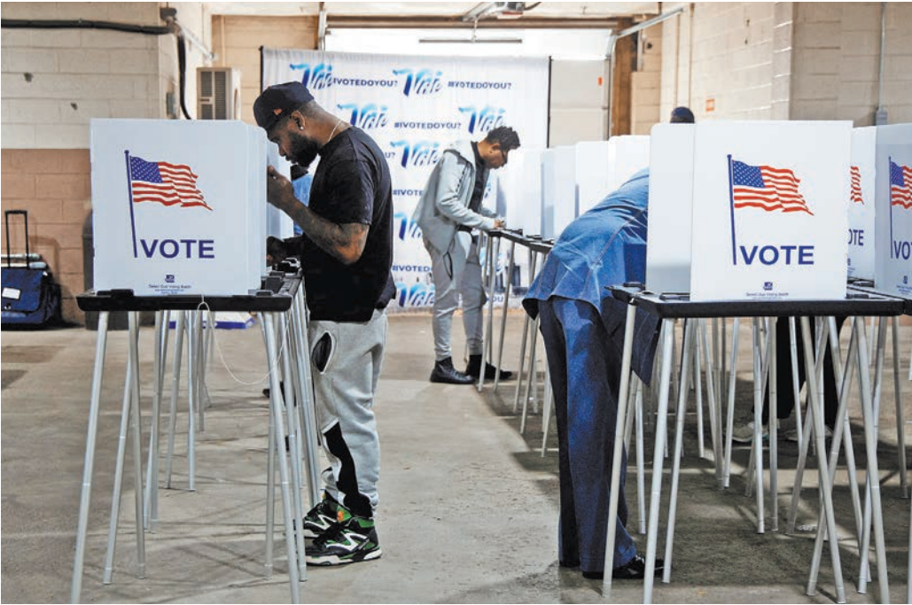
50 миллионов американцев уже проголосовали досрочно. Остальным это еще предстоит.

Теперь добавились невиданные возможности для манипуляций при помощи современных коммуникационных средств. И правящие политические силы, способные серьезно корректировать манипулятивные усилия, в состоянии довольно заметно воздействовать и на направление общего развития страны. Глобалистская часть истеблишмента значительно влияла с конца XX века. Тем важнее идейно-политический набор, который возобладает после этих выборов. ●