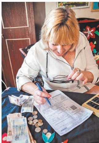
Льготники имеют право на компенсацию по квартплате, а семьи с низкими доходами — на субсидии.

Теперь порядок прописан гораздо более четко. При оформлении компенсации должны учитываться сведения о подтвержденной вступившим в законную силу судебным актом непогашенной задолженности по оплате жилья и коммунальных услуг, образовавшейся не более чем за три последних года. Кроме того, органы, которые занимаются оформлением компенсаций, могут не ждать