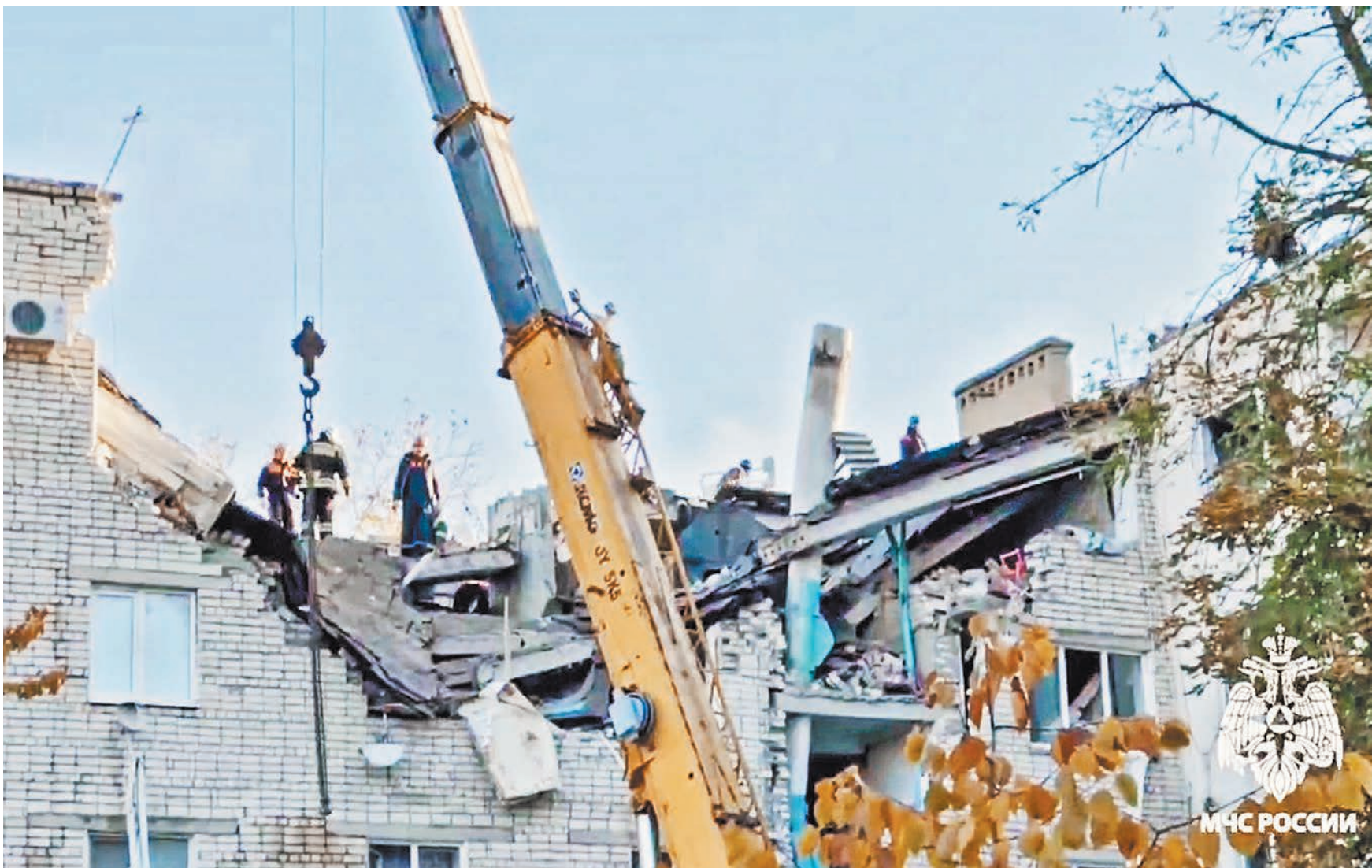
ЧП произошло в одной из квартир пятиэтажного дома по улице Лободина, 61А.

Одновременно со спасателями и строителями к работе подключились сотрудники и эксперты-криминалисты Следственного комитета РФ и прокуратуры. Им предстоит установить точную причину взрыва газовой смеси. «Прокуратурой города организована проверка по факту взрыва газа и будет дана оценка соблюдению требований законодательства, регламентирующего порядок эксплу-