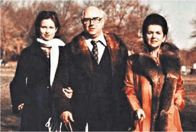
ИЗ СЕРИЕЛЬНОГО АРХИВА СЕМЛИ РОСТРОПОВИЧ