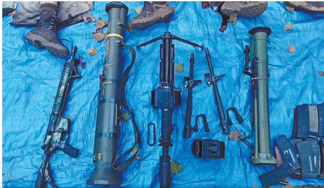
У наемников после их уничтожения были изъяты ручные гранатометы, пулеметы, автоматы и много взрывчатки.