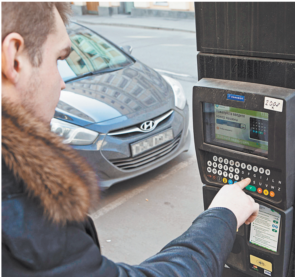
Штраф за неоплату парковки установлен вдвое меньший, чем в столице, — в размере 2,5 тысячи рублей.

Тариф введен плавающий — 40 рублей в час вблизи железнодорожных станций и платформ и 50 рублей — на обычных улицах. Для оплаты в Подмосковье не стали изобретать велосипед, а воспользовались сервисами, разработанными в