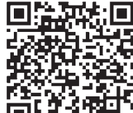
Фото и видео с выставки смотрите на сайте «РГ».

История Товарищества продолжалась более 50 лет. Она заканчивается в 1923 году. Нынешняя выставка «Передвижники» ограничивается историей с 1870-х до конца 1890-х. И завершается не на триумфальной, а на задумчивом ноте. Последний раздел «Отвергнутые» представляет конфликты внутри Товарищества, борьбу за новое искусство внутри сообщества. ●