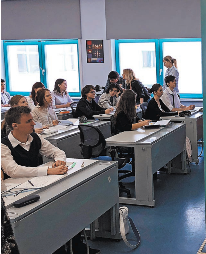
Пользоваться мобильниками закон разрешает ученикам только на переменах, до и после уроков.

— Как правильно подготовить ребенка к школе в домашних условиях rg.ru/art/2889688