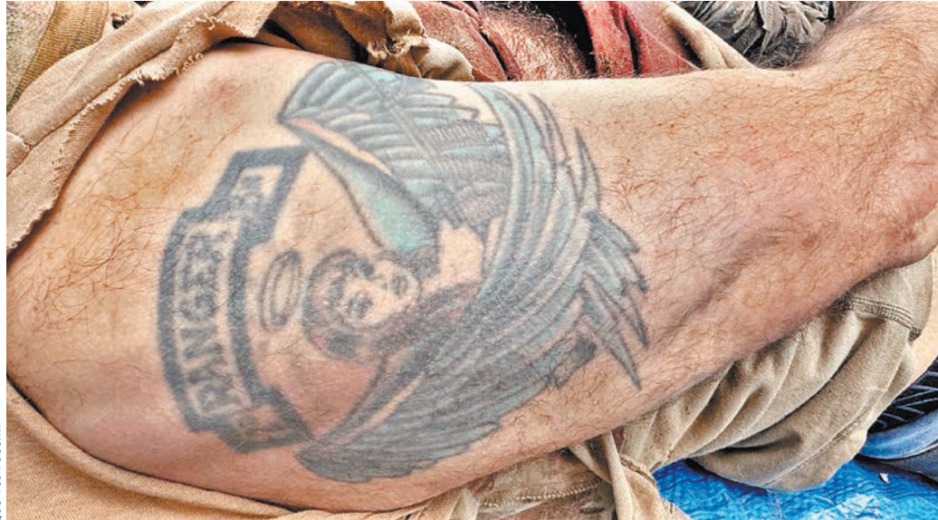
Татуировка на руке погибшего наемника подтверждает его принадлежность к подразделению рейнджеров в США.