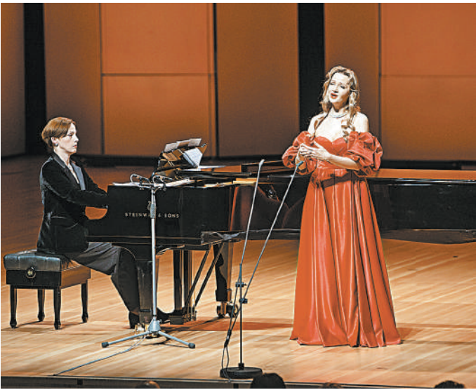
Абсолютное большинство участников обладает интересными, пусть еще и не ограниченными, оперными голосами.

В «Оперном классе» уже работали над «Золушкой» и «Севильским цирюльником» Россини, спектаклем «Амадеус. Лаборатория оперы» — коллаж из трех моцартовских опер «Свадьба Фигаро», «Дон Жуан», «Так поступают все», «Дитя и волшебство» Равеля. Однажды занятия посвятили «Школе ма-