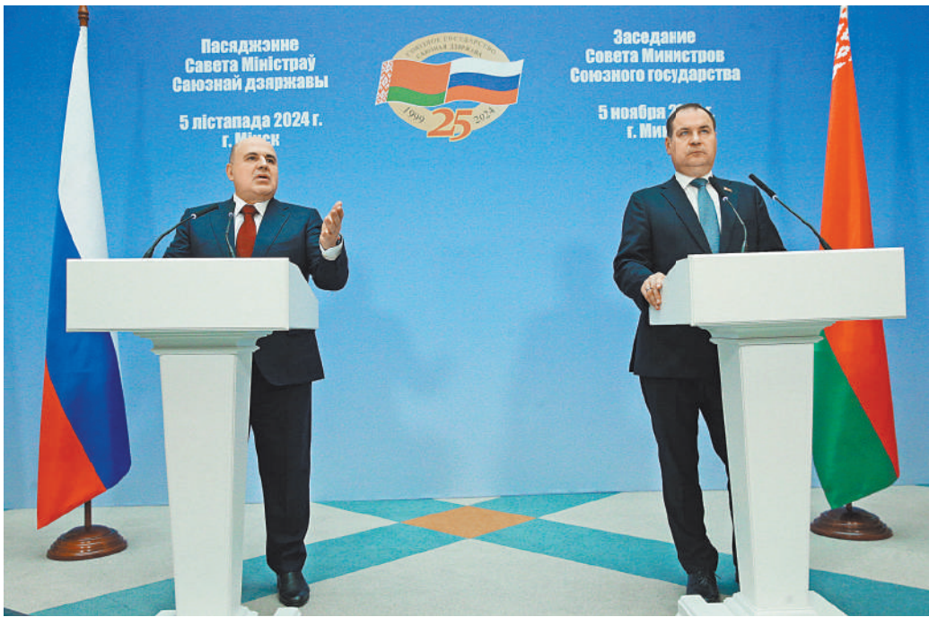
Михаил Мишустин и Роман Головченко во время совместного заявления для прессы.

Рассмотрели и вопрос о придании продукции российских и белорусских производителей статуса «товара Союзного государства». ●