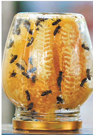
Фермеры предлагают как натуральный продукт, так и мед с добавками, мед-суфле и мед в сотах.

Ассортимент очень широкий, и наблюдается здоровая конкуренция между производителями за внимание клиентов к их товарам, добавили в Ozon. Продажи меда растут год к году: в третьем квартале 2024 года оборот таких товаров был на 70% выше, чем за аналогичный период годом ранее.