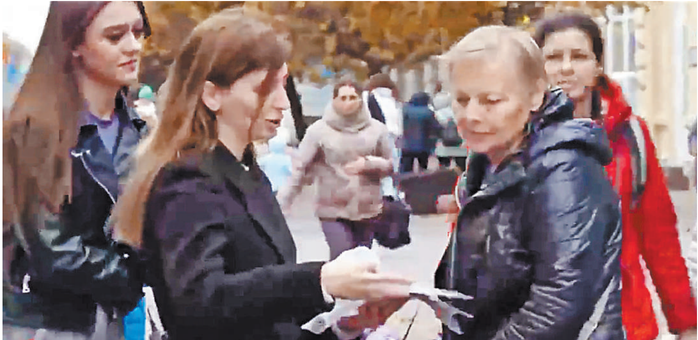
Работа «языковых патрулей» в Ивано-Франковске — показатель полного распада украинского государства.

Россияне этот потенциал будут активно осваивать. Так, еще на импортной ЭКСПО-2023 бизнесмены из РФ заговорили о перспективах кратного увеличения российско-китайского товарооборота: с нынешних $200 млрд до $500 млрд в будущем. Хотя такие планы официально пока не закреплены, власти поддерживают расчеты предпринимателей. Так, первый заместитель министра промышленности и торговли Василий Осмаклов на прошлой ЭКСПО в интервью CGTN заявил: «Потенциал развития торговли с Китаем измещается не процентами, а десятками процентов, возможно, мы даже можем говорить о порядках. Потому что китайский рынок огромный, и мы очень много можем сделать для Китая. У нас очень недоиспользованный потенциал экспорта в несерьезном направлении. Если мы будем активно работать, обозначенные цифры вполне достижимы». ●