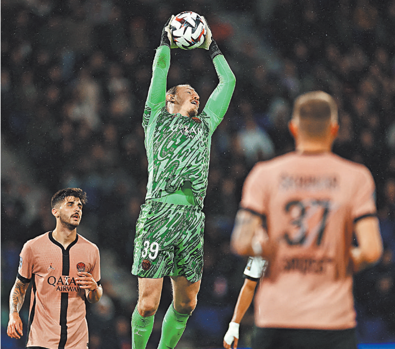
Голкипер сборной России Матвей Сафонов потихоньку отвоевывает место в стартовом составе «ПСЖ».

— Хочу, чтобы Сафонов готов был выйти на поле в любой момент, как и Доннарумма или Арнау Тенас. Это касается как голкиперов, так и полевых игроков.