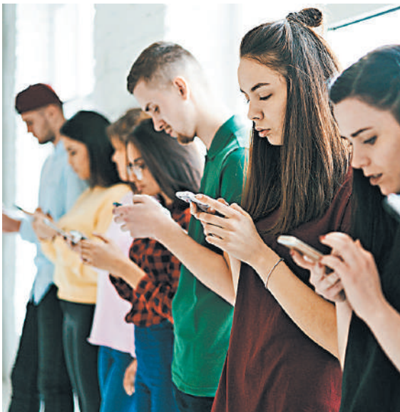
Большое влияние на Рунет оказало быстрое и качественное развитие мобильной связи.