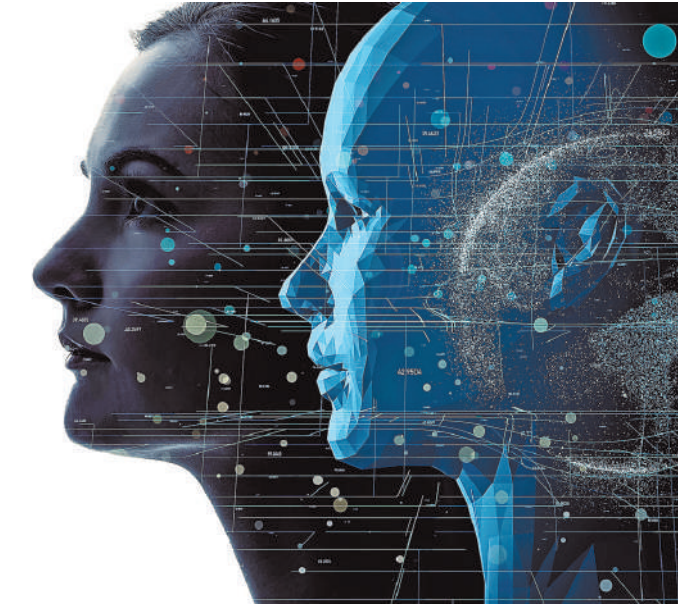
Цифровой образ сознания человека сегодня уже не кажется далекой фантастикой.

Когда модель сможет отвечать на вопросы «кто я» и «зачем я», тогда мы дойдем до «сознания в цифре»