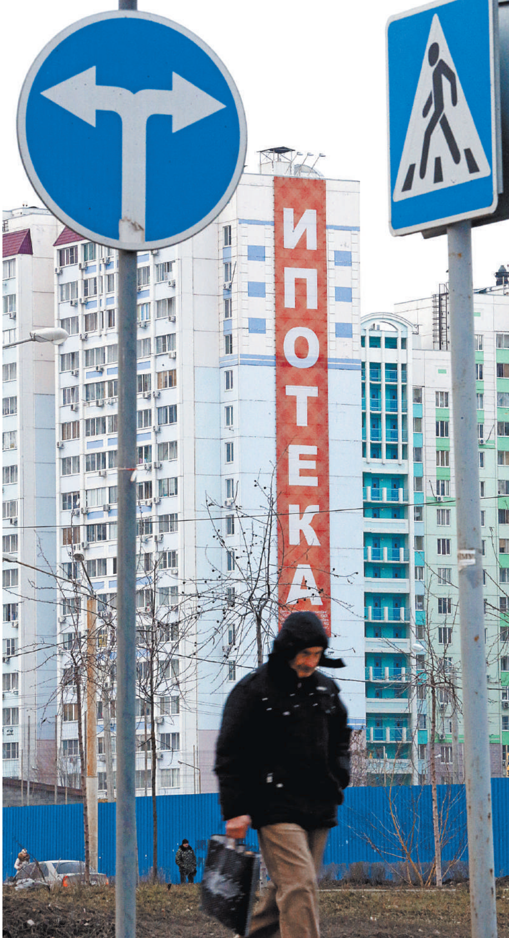
Ипотечный кредит сегодня есть примерно у 15% российских семей, по мере снижения ставок спрос будет расти.