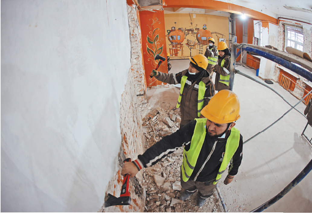
Работы в школе на Тихвинской, по оценке педагогов, идут очень активно.

В планах у строителей действительно оставить по сути только фундамент да несущие стены. Фасад и кровлю им предстоит привести в порядок, инженерные коммуникации — заменить, как и дверные и оконные блоки. В процессе перепланировки внутренних помеще-