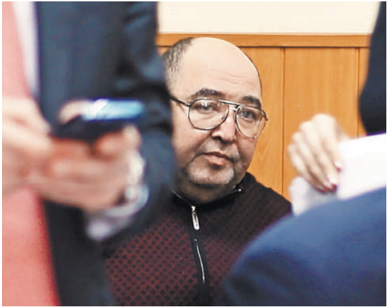
В случае тяжелой болезни осужденного могут освободить. Именно так и произошло с экс-сенатором Борисом Шпигелем.

Было установлено, что Борис Шпигель платил главе региона взятки за предоставление своим фармкомпаниями конкурентных преимуществ при заключении госконтрактов в Пензенской области. ●