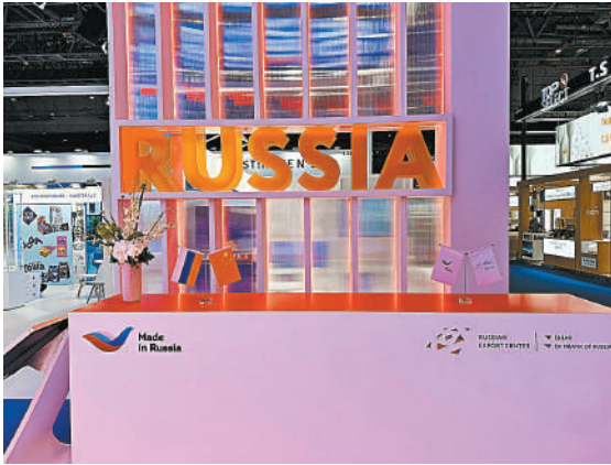
Проведение ярмарки «Сделано в России» будет одним из инструментов продвижения наших товаров за рубежом.

С окончанием выставки в Шанхае большая российская бизнес-миссия в Китае будет продолжена ярмаркой «Сделано в России», которая состоится 11–17 ноября в Чэнду. На ней будет представлено даже больше компаний, чем на импортной ЭКСПО: порядка 130.