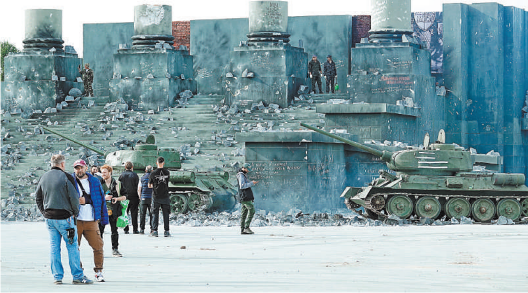
Здесь очень реалистичные декорации — какой бы период истории они ни представляли.

Выставка будет проходить до 20 ноября 2024 года.