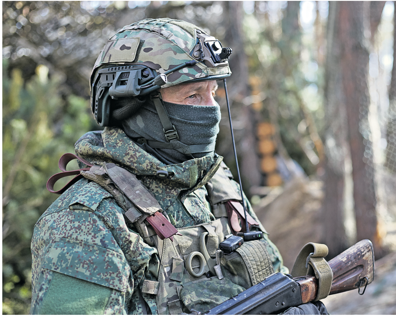
13 марта. Командир орудия «Мста-С» с позывным «Сибирь» в зоне СВО.

— Мне цель посчитать — минута, — говорит «Липа». Снаряд лет точно в цель. Внутри, по словам офицера, находились еще и боеприпасы. После удара, как он формулирует, «от цели просто ничего не осталось. Пепелище». Объективный контроль по таким целям батареи запрашивает всегда, и в этом случае поражение было подтверждено. «Липа» пришел в ВС РФ в 2024 года добровольно, родом из Липецка, начал командиром орудия, затем получил звание младшего лейтенанта и был назначен старшим офицером батареи, команди-