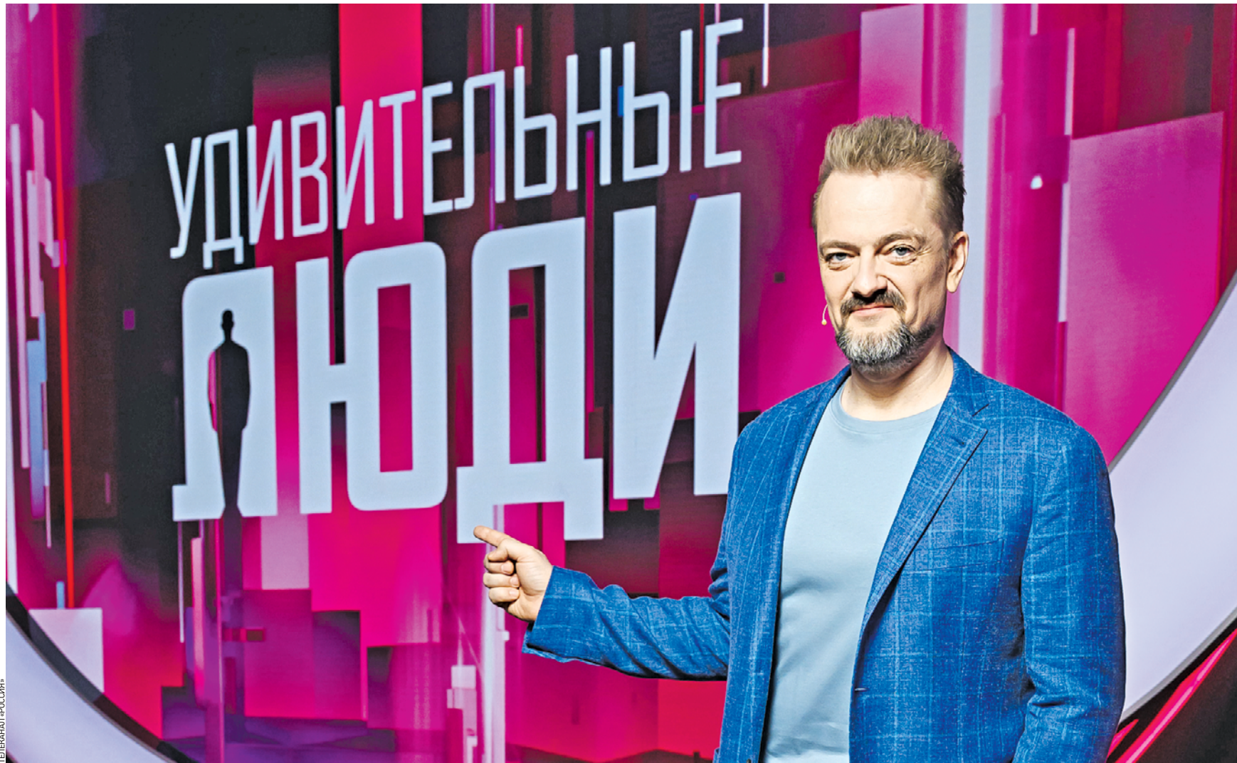
Член жюри шоу «Удивительные люди», телеведущий и популяризатор наук Александр Пушной в студии перед началом съемок. Александр признался, что хотел в этом сезоне стать «злым» ведущим, но из этой затеи у него ничего не получилось — слишком уж удивительные собрались на шоу участники!

Что важно: в шоу нет никаких ограничений по возрасту: самой юной участнице нового сезона всего два года, а самому старшему — 59 лет. У проекта весьма внушительный географический размах — в нем принимают участие как люди из российских регионов, так и жители стран ближнего и дальнего зарубежья. Восьмой сезон, как обещают организаторы шоу, станет