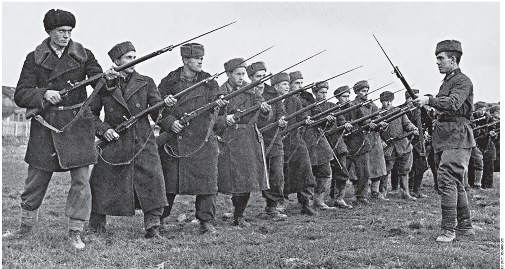
24 октября 1941 года. Бойцы 1-го батальона 1-го Московского коммунистического полка 3-й Московской дивизии народного ополчения

— В январе 1942 года дивизию направили на Северо-Западный фронт для участия в Демянской операции по разгрому крупной немецкой группировки в районе Демянска. В феврале 1942 года вокруг 16-й армии вермахта замкнулось первое в истории