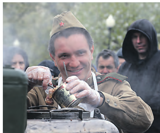
9 мая 2022 года. Повар полевой кухни готов накормить всех гостей праздника в Парке Горького