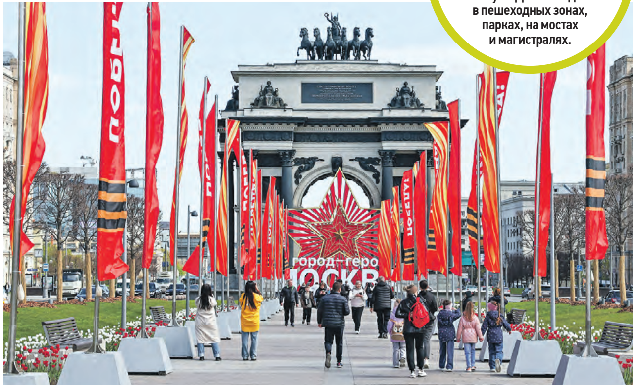
4 мая. Праздничное оформление у Триумфальной арки в преддверии празднования 79-й годовщины Победы

тысячи флагов украсили Москву ко Дню Победы — в пешеходных зонах, парках, на мостах и магистралях.