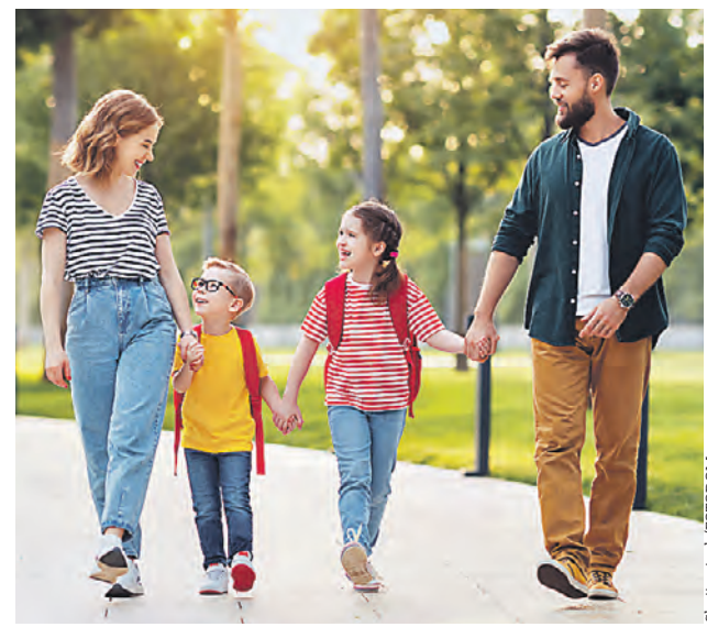
Собирая детей на праздничные мероприятия, выбирайте яркую одежду, которую видно издали